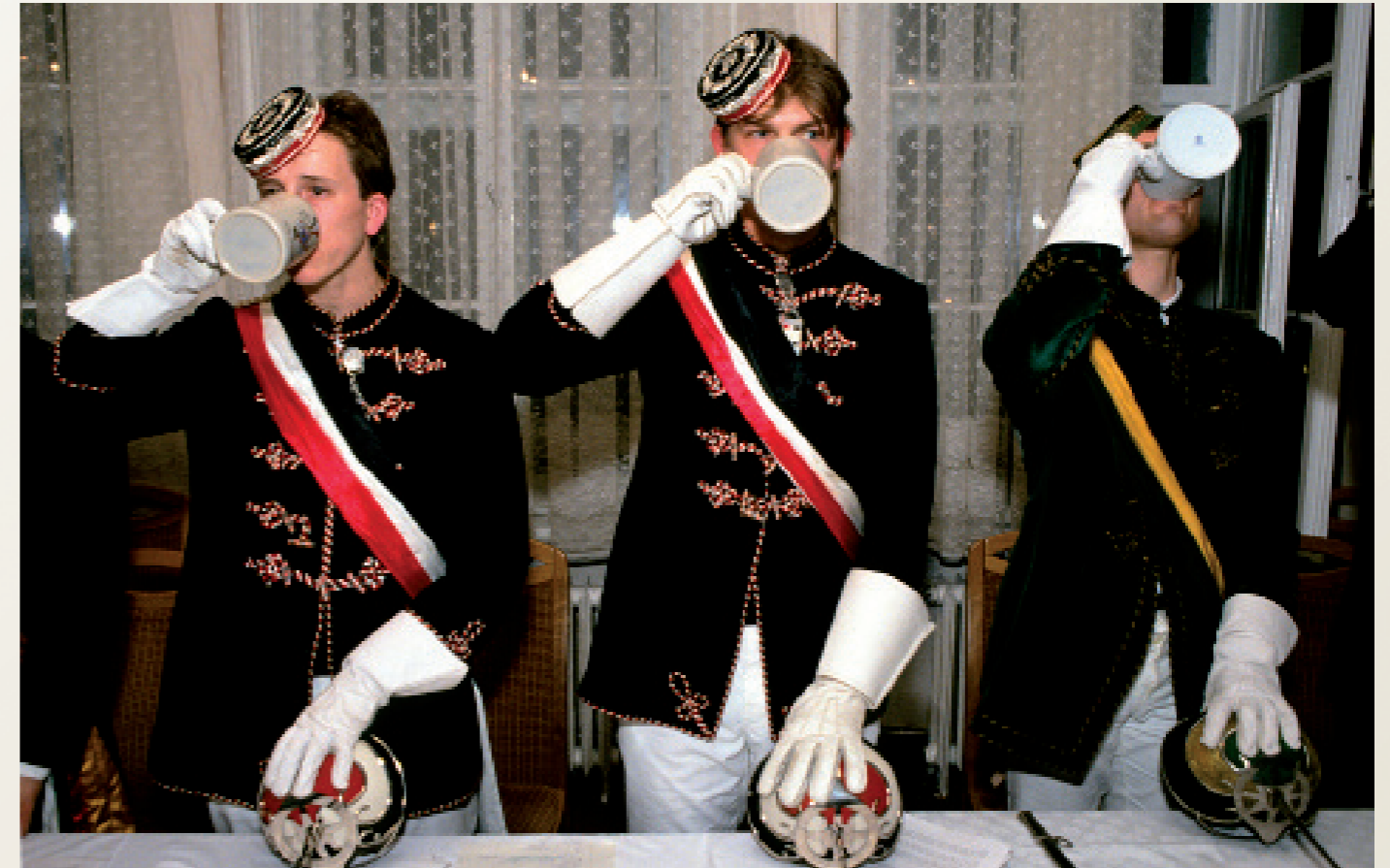
Nach der Wende in der ehemaligen DDR/ Greifswald

Demonstration gegen ein drohendes Werftens- terben in Mecklenburg-Vorpommern vor der Staatskanzlei ( Gregor Gysi, Bundes-Vorsitzender der PDS ( Bildmitte ), Helmut Holter, PDS-Lan- desvorsitzender. Mecklenburg-Vorpommern ( rechts ).