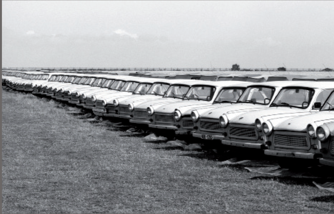
Nach der Wiedervereinigung/ Salzwedel