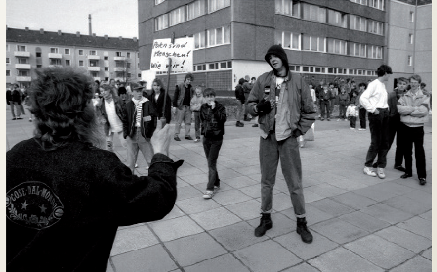
Nach der Wiedervereinigung/ Frankfurt/ Oder

Die ersten Tarifverhandlungen zwischen Nordmetall und der IG Metall nach der Wiedervereinigung in Mecklenburg-Vorpommern. Lehrlinge tragen lautstark ihre Forderungen am Verhandlungsort ( Hotel Neptun ) vor.