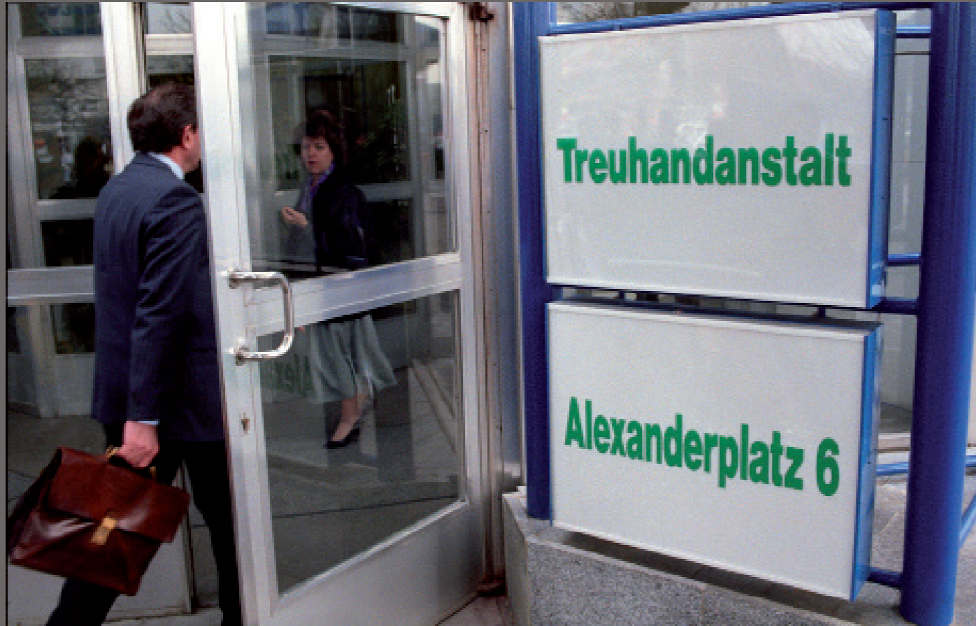
Nach der Wiedervereinigung/ Berlin