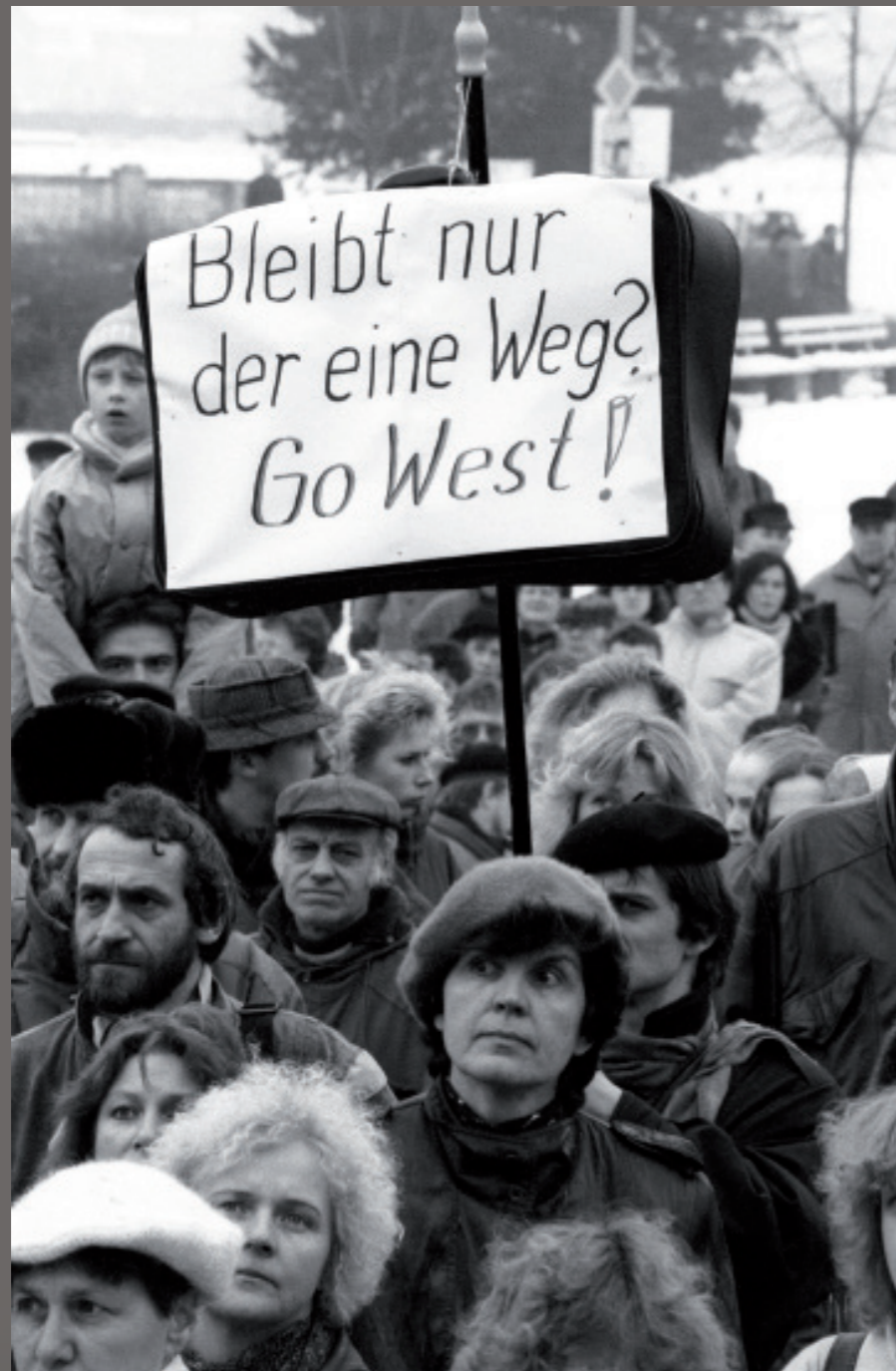
Nach der Wiedervereinigung/ Schwerin