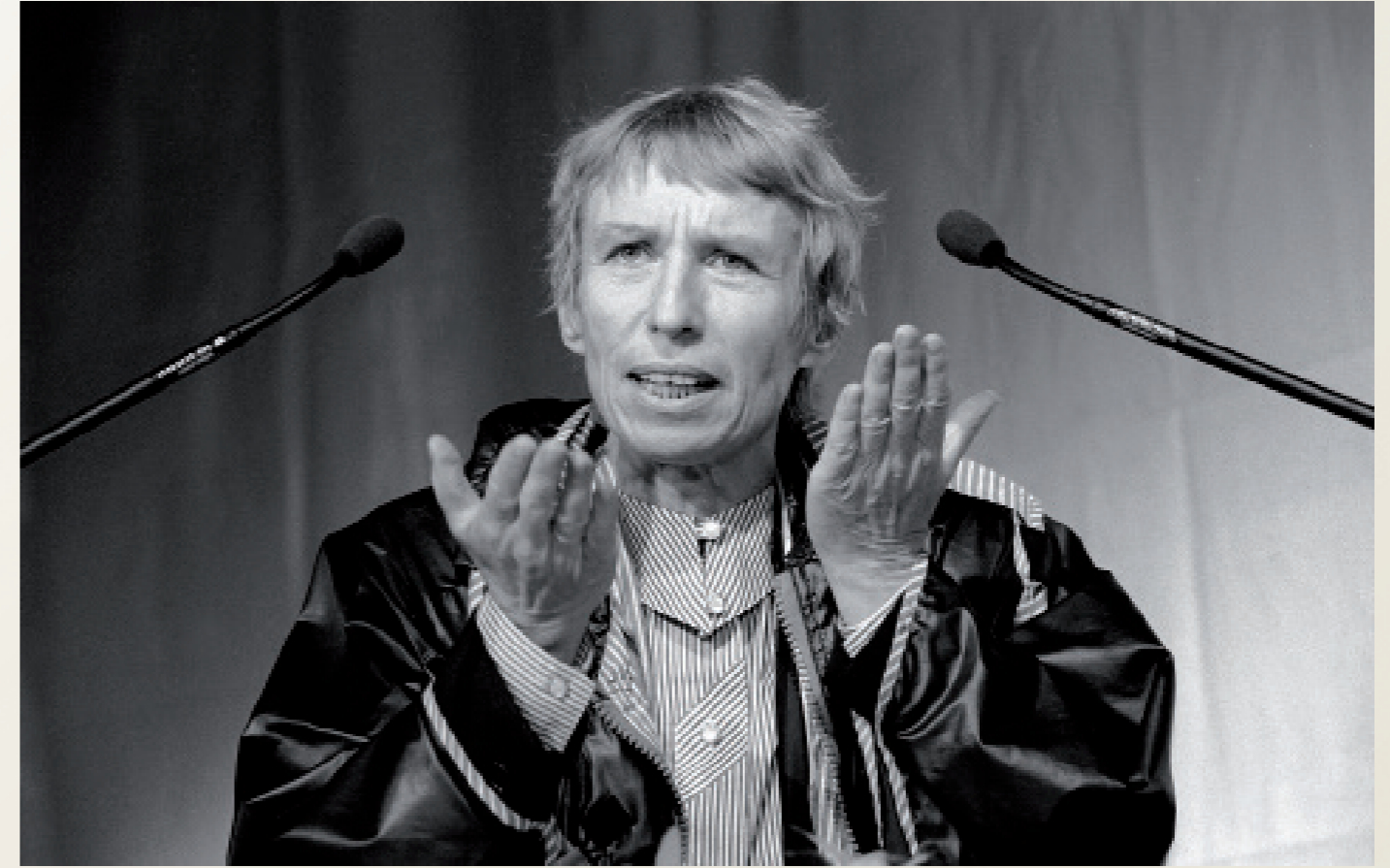
Nach der Wiedervereinigung/ Hamburg

Regine Hildebrandt ( SPD-Sozialministerin in Brandenburg ) spricht auf einer Bürgerschafts-Wahlkampfveranstaltung der Hamburger SPD.