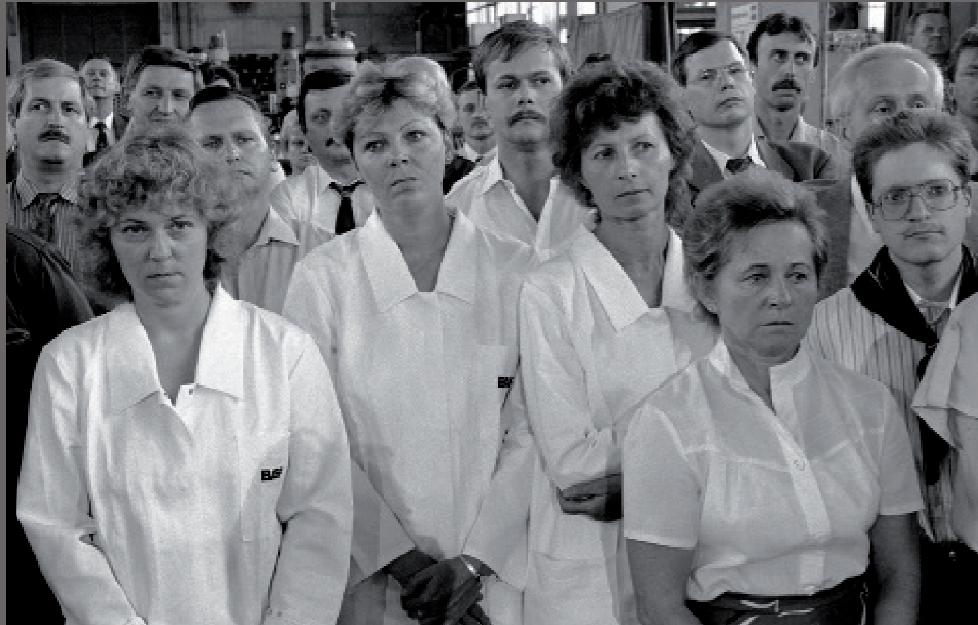
Nach der Wiedervereinigung/ Schwarzheide