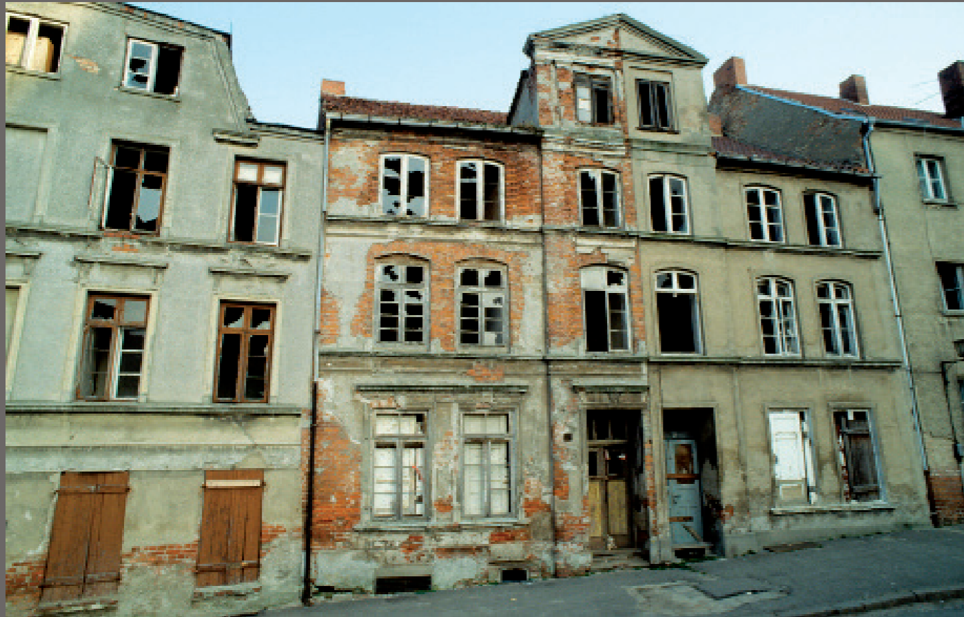
DDR nach der Wende/ Wismar