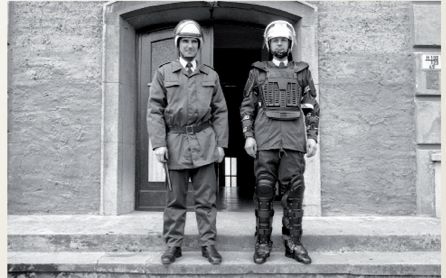
Nach der Wiedervereinigung/ Schwerin