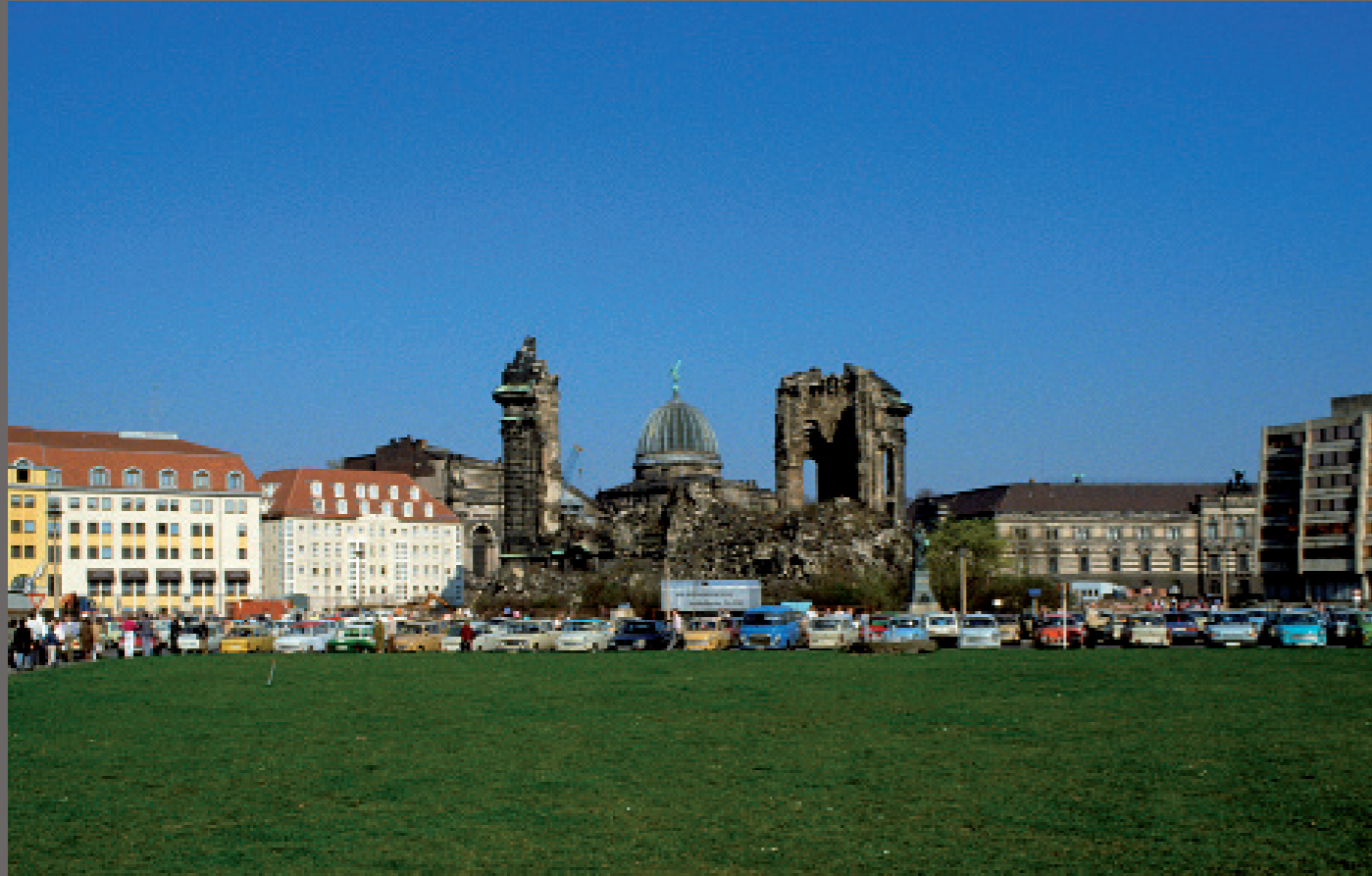
Nach der Wiedervereinigung/ Dresden