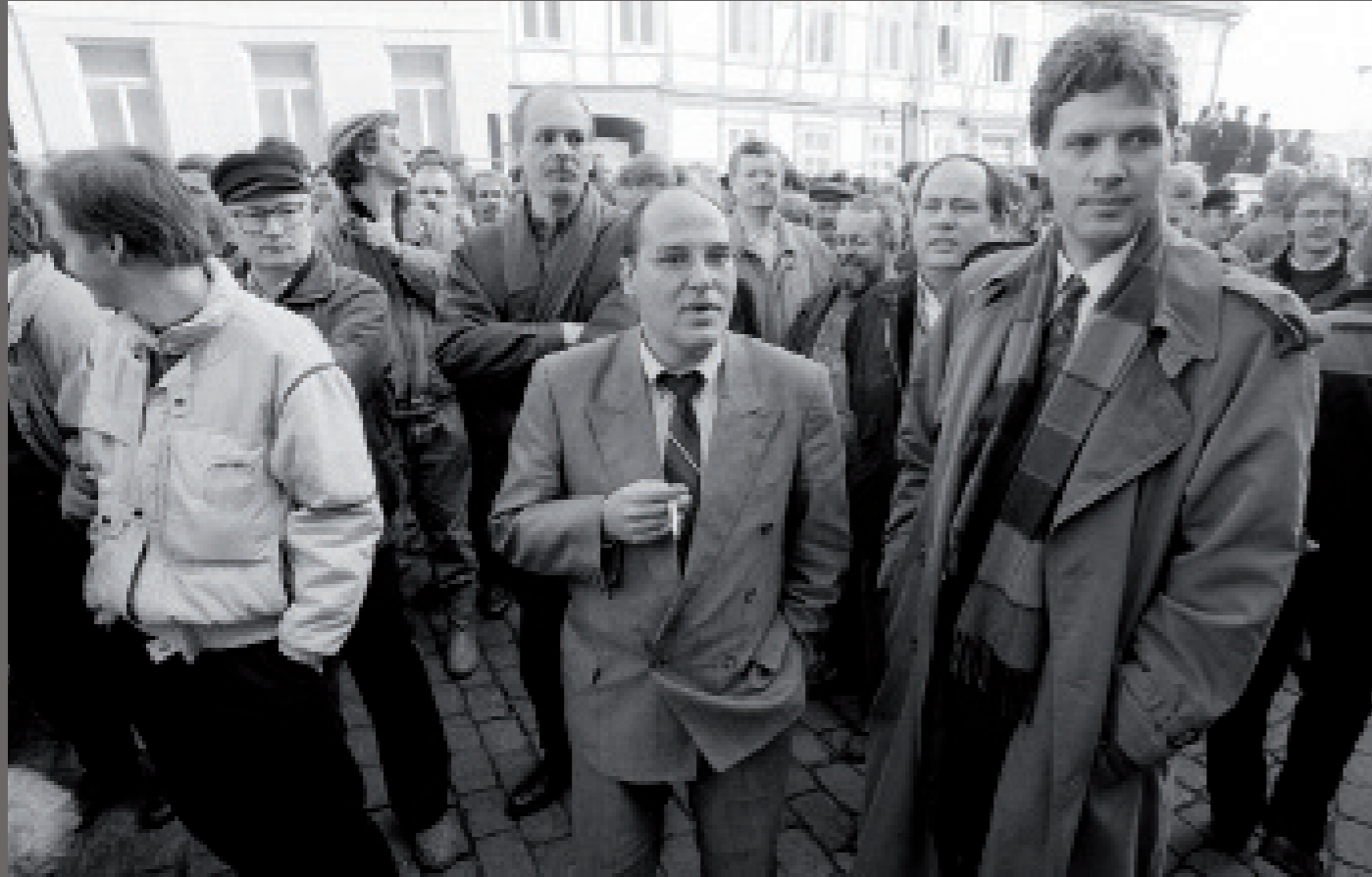
Nach der Wiedervereinigung/ Schwerin