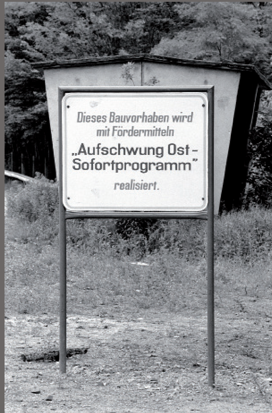
Nach der Wiedervereinigung/ Lauchhammer