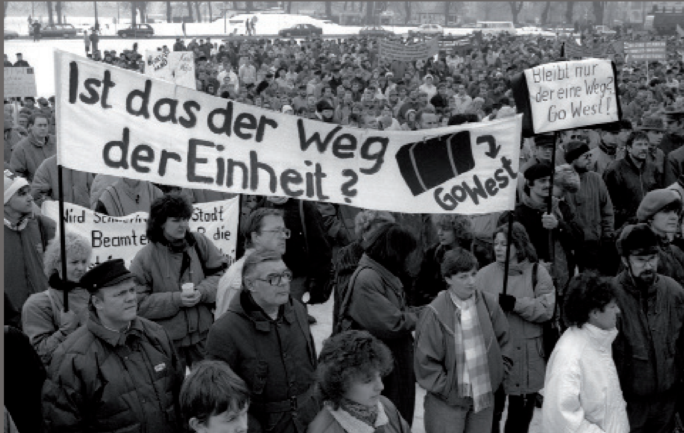
Nach der Wiedervereinigung/ Schwerin