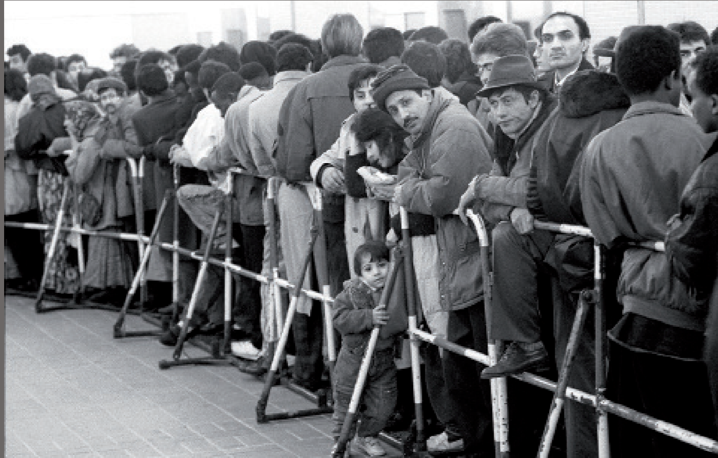
Zusammenbruch des Ostblocks, Flüchtlinge/ Hamburg