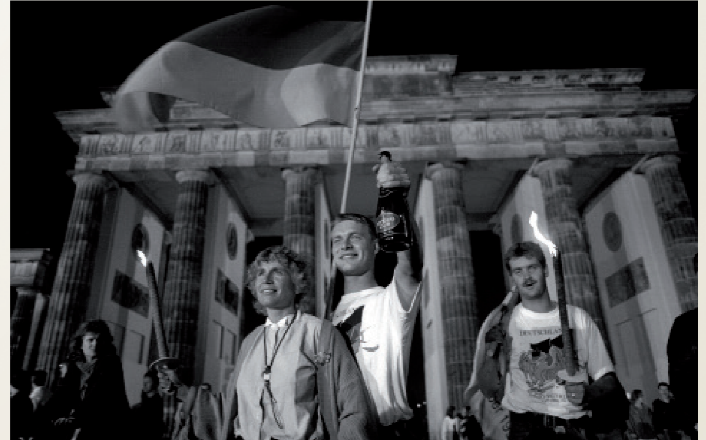
Tag der Deutschen Einheit/ Berlin

Abzug der Sowjetarmee aus dem wiedervereinten Deutschland. Verlassene sowjetische Kaserne bei Fürstenberg ( Mecklenb.-Vorp. ). Abgebautes und von Gras überwachsenes kommunistische Symbol Hammer und Sichel.