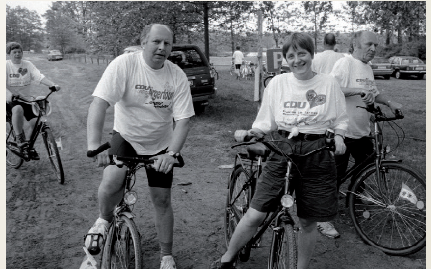
Nach der Wiedervereinigung/ Plau am See

Abzug der Roten Armee aus Mecklenburg-Vorpommern. Ehrenformation von russischen Soldaten vor der Abschiedszeremonie.