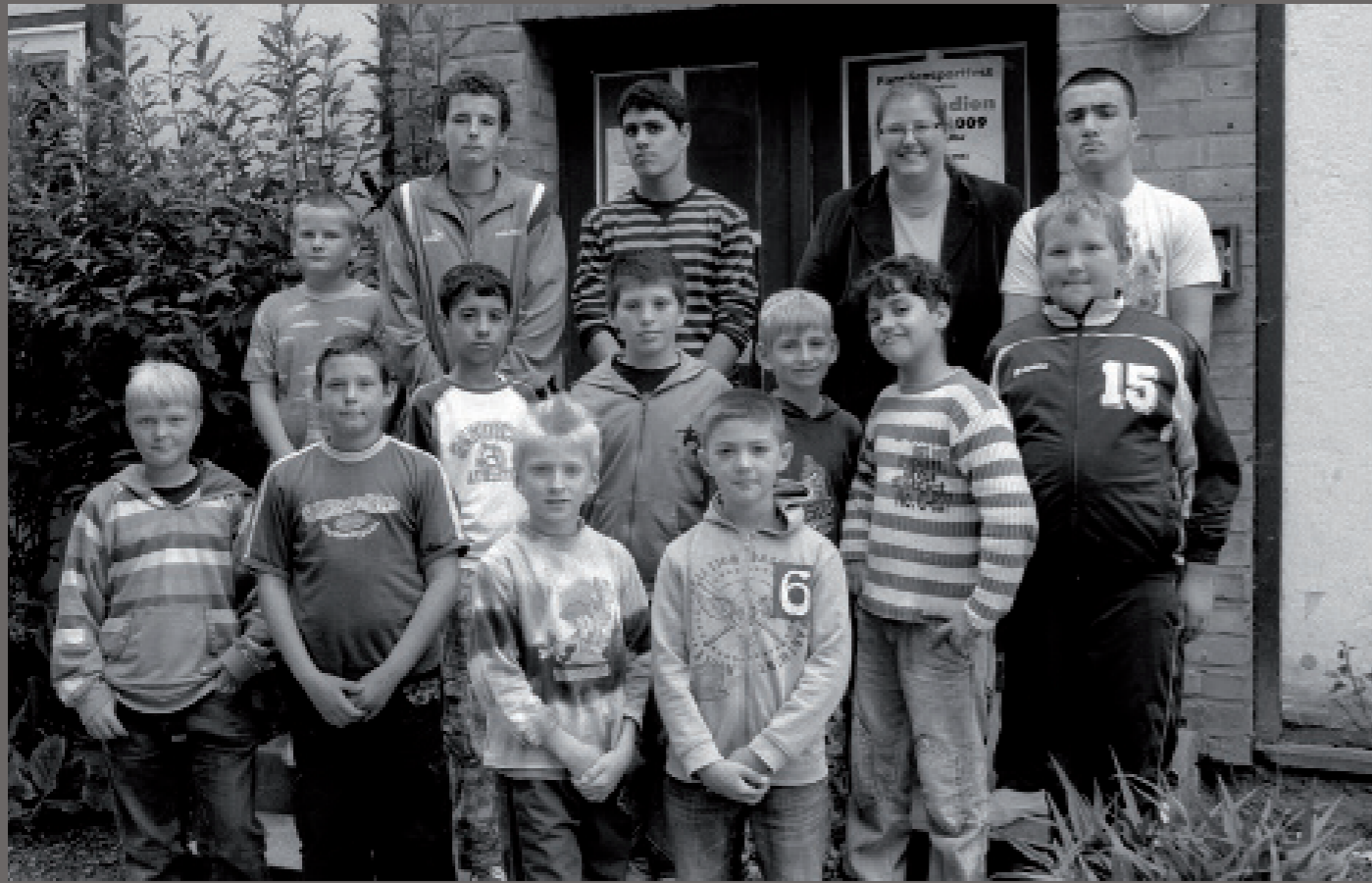
Nach der Wiedervereinigung/ Schönberg ( Mecklenburg-Vorpommern )