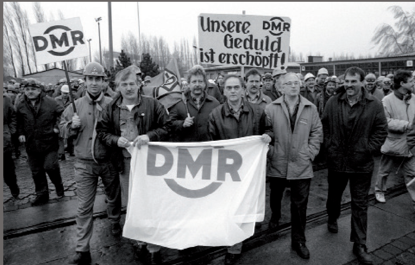
Nach der Wiedervereinigung/ Warnemünde