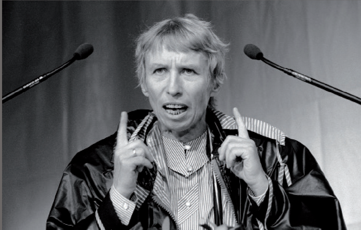
Nach der Wiedervereinigung/ Hamburg