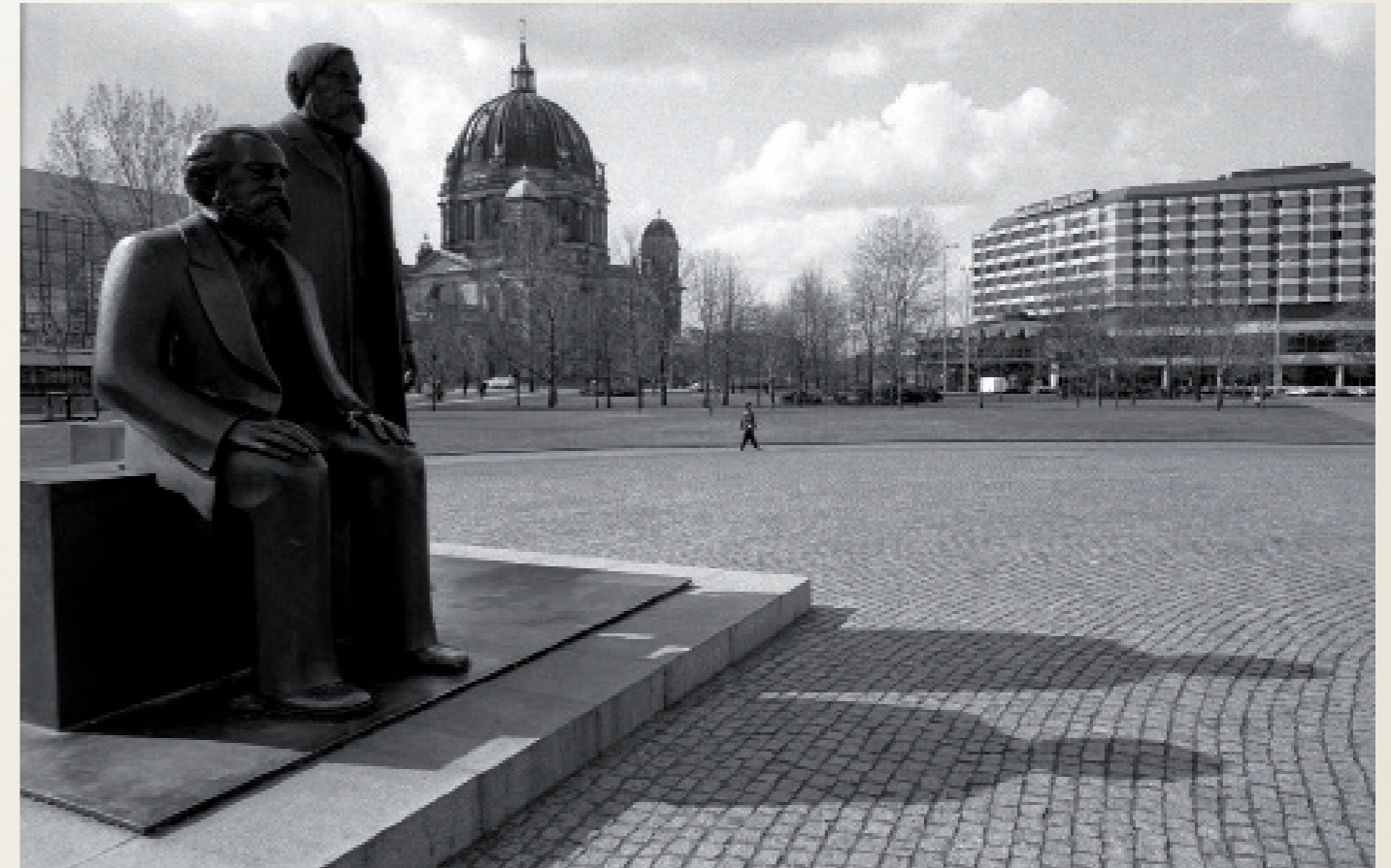
Nach der Wiedervereinigung/ Berlin

Arbeiter der „Sächsischen Aufbau-und Qualifizierungsgesellschaft“ ( SAQ ) ehemals Sachsenring Automobilwerke. Es hieß „ Rückbau“ der alten Trabi-Produktionsanlagen, was nichts anderes als Abriß ihrer alten Arbeitsplätze bedeutete.