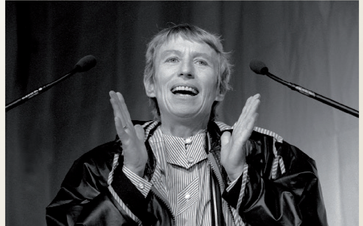
Nach der Wiedervereinigung/ Hamburg

Regine Hildebrandt ( SPD-Sozialministerin in Brandenburg ) spricht auf einer Bürgerschafts-Wahlkampfveranstaltung der Hamburger SPD.