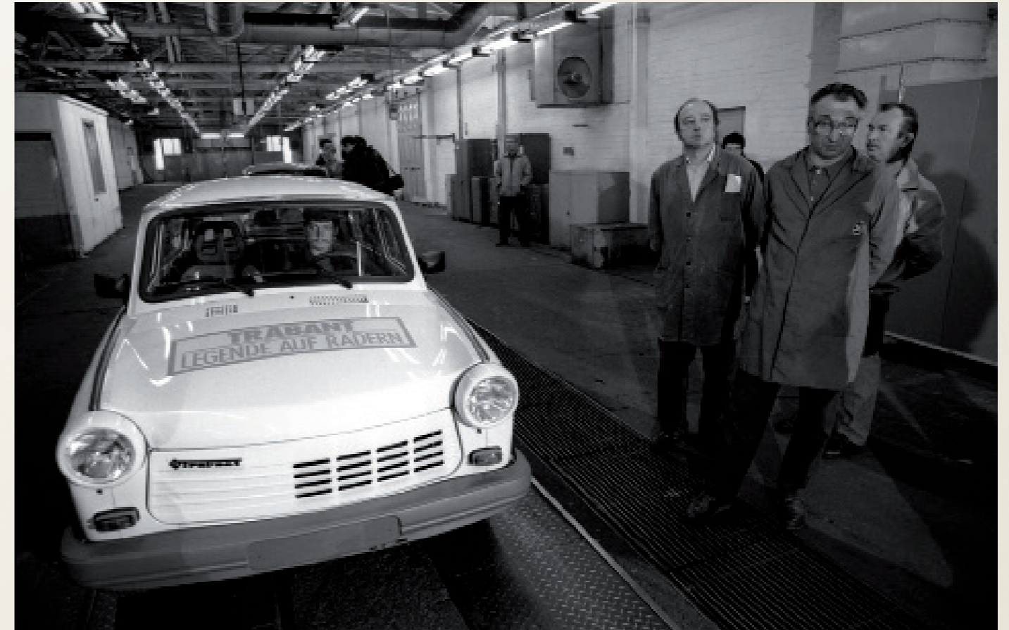
Nach der Wiedervereinigung/ Zwickau