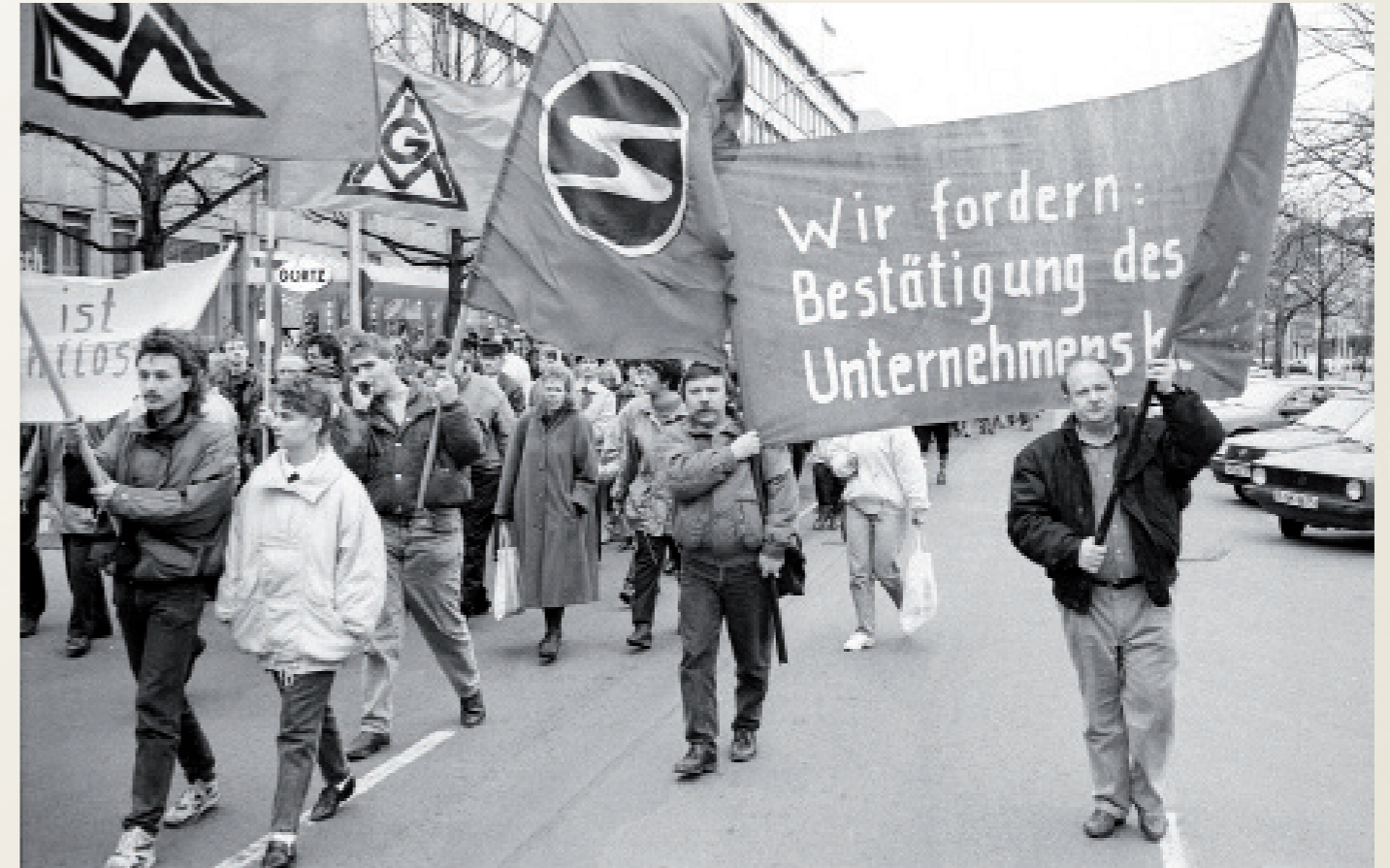
Nach der Wiedervereinigung/ Berlin

Bundeskanzler Helmut Kohl und Ehefrau Hannelore Kohl beim Rundgang durch die Stadt am Tag der Deutschen Einheit.