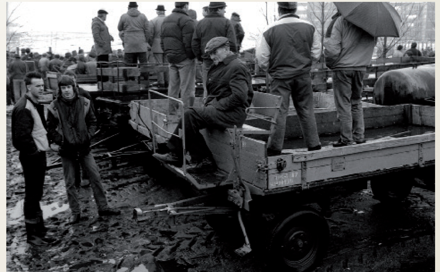
Nach der Wiedervereinigung/ Schönberg ( Mecklenburg-Vorpommern )

Demonstration der IG Metall gegen die Vorgehensweise der „Treuhand“.