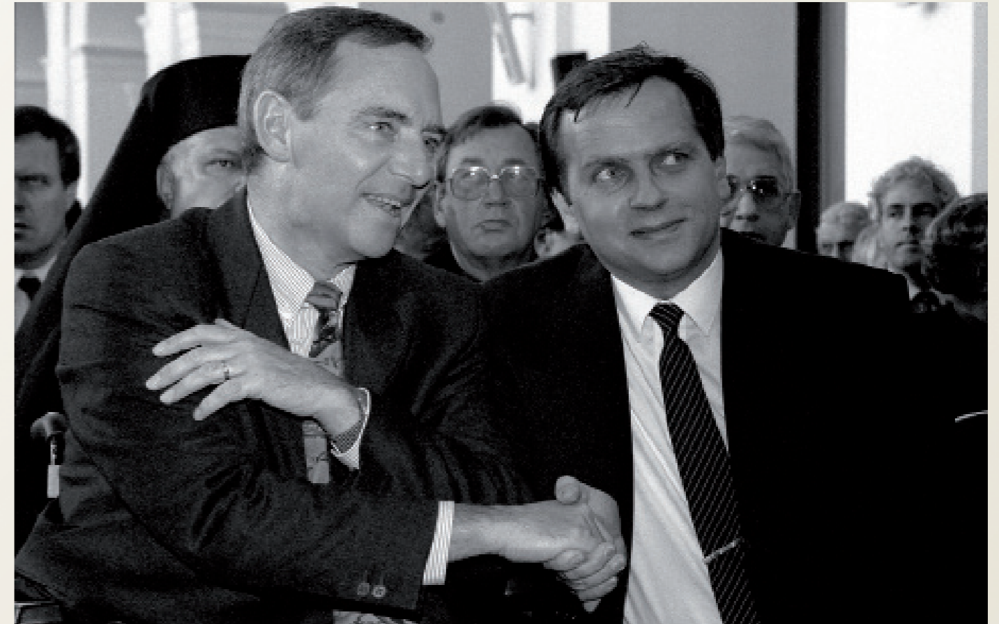
Nach der Wiedervereinigung/ Hamburg

Nazis fahren anlässlich eines Parteitages der Republikaner ( Reps ) mit Hakenkreuzfahne und Hitlergruß durch die Stadt.