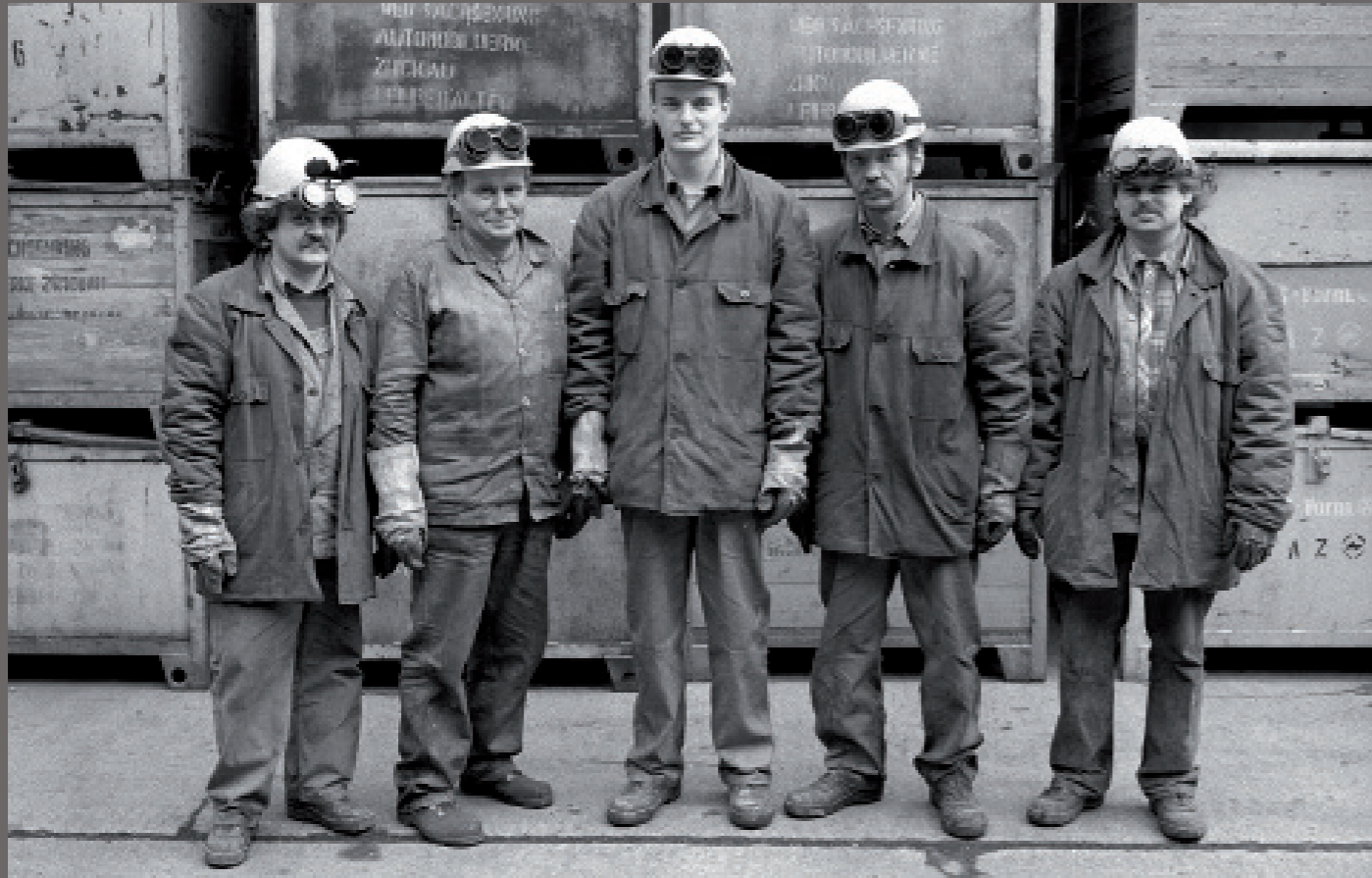
Nach der Wiedervereinigung/ Zwickau