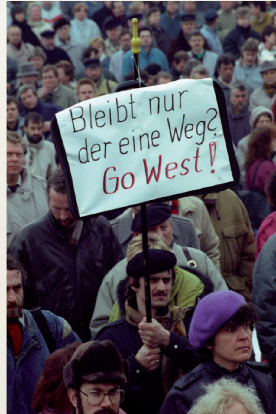
Nach der Wiedervereinigung/ Schwerin

Demonstration gegen die Arbeitsplatzvernichtung der Treuhandanstalt.