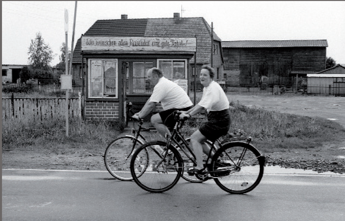
Nach der Wiedervereinigung/ Klebe