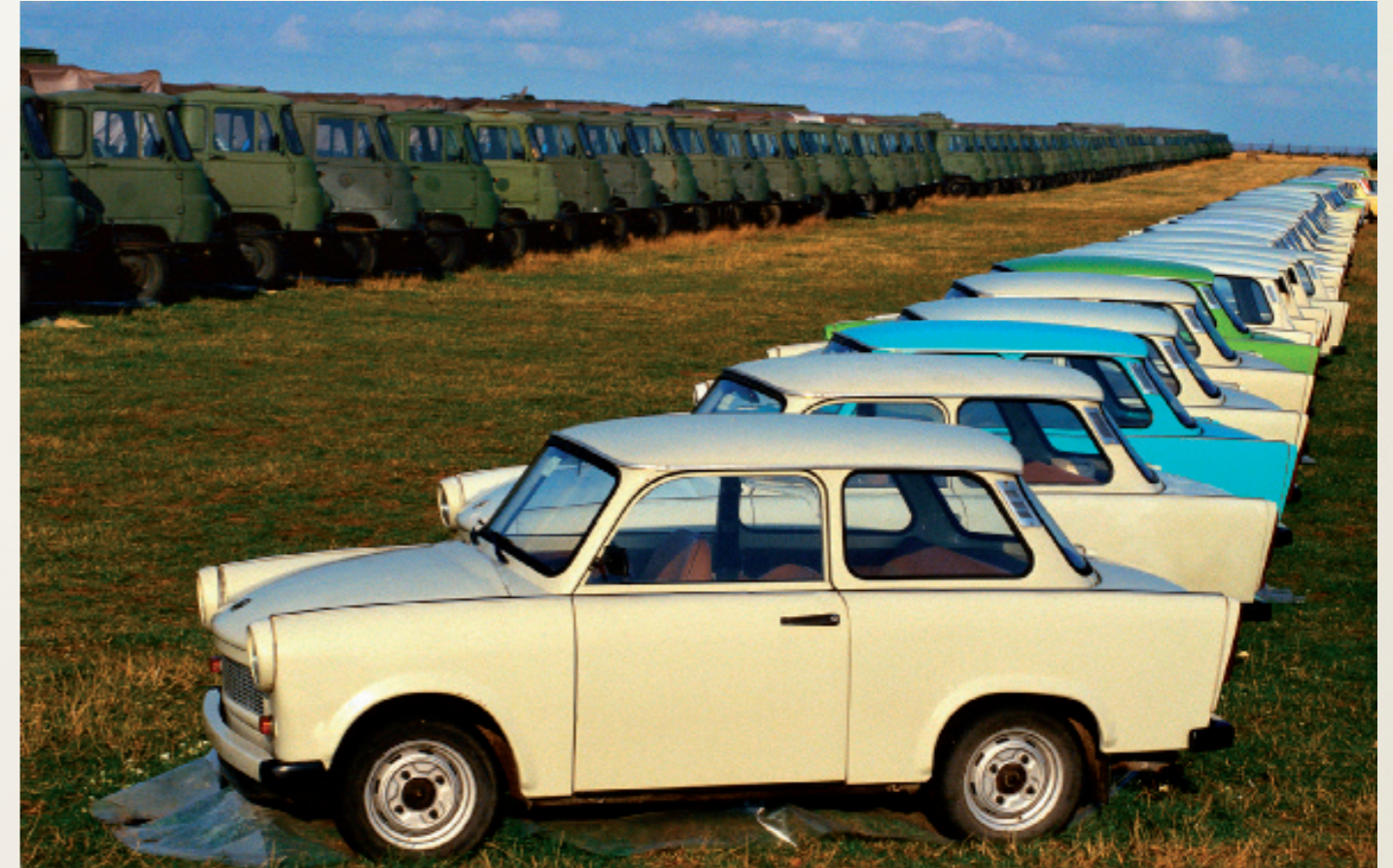
Nach der Wiedervereinigung/ Salzwedel

Gründungsversammlung ( Festcommers ) der ersten Burschenschaft nach der Wende in Mecklenburg-Vorpommern.