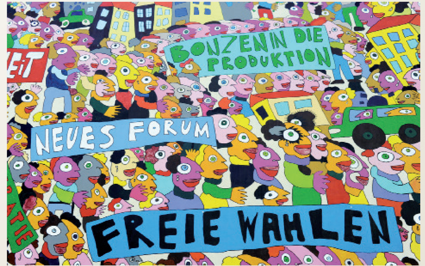
Nach der Wiedervereinigung/ Leipzig