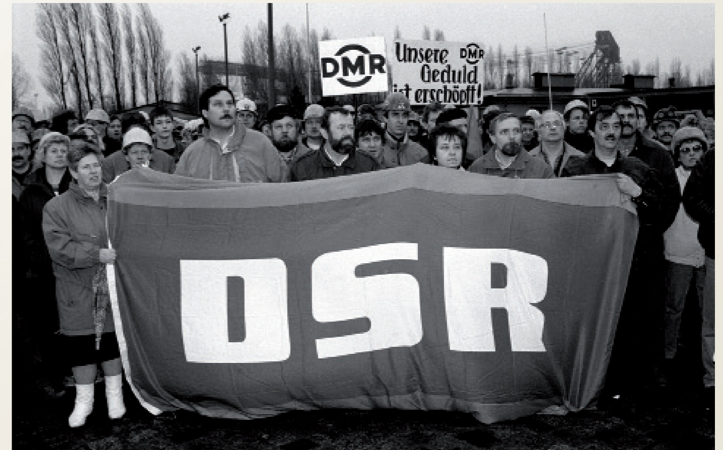
Nach der Wiedervereinigung/ Warnemünde

Plakate gegen drohendes Werftensterben ( hier am Zaun der Neptun-Warnowwerft ).