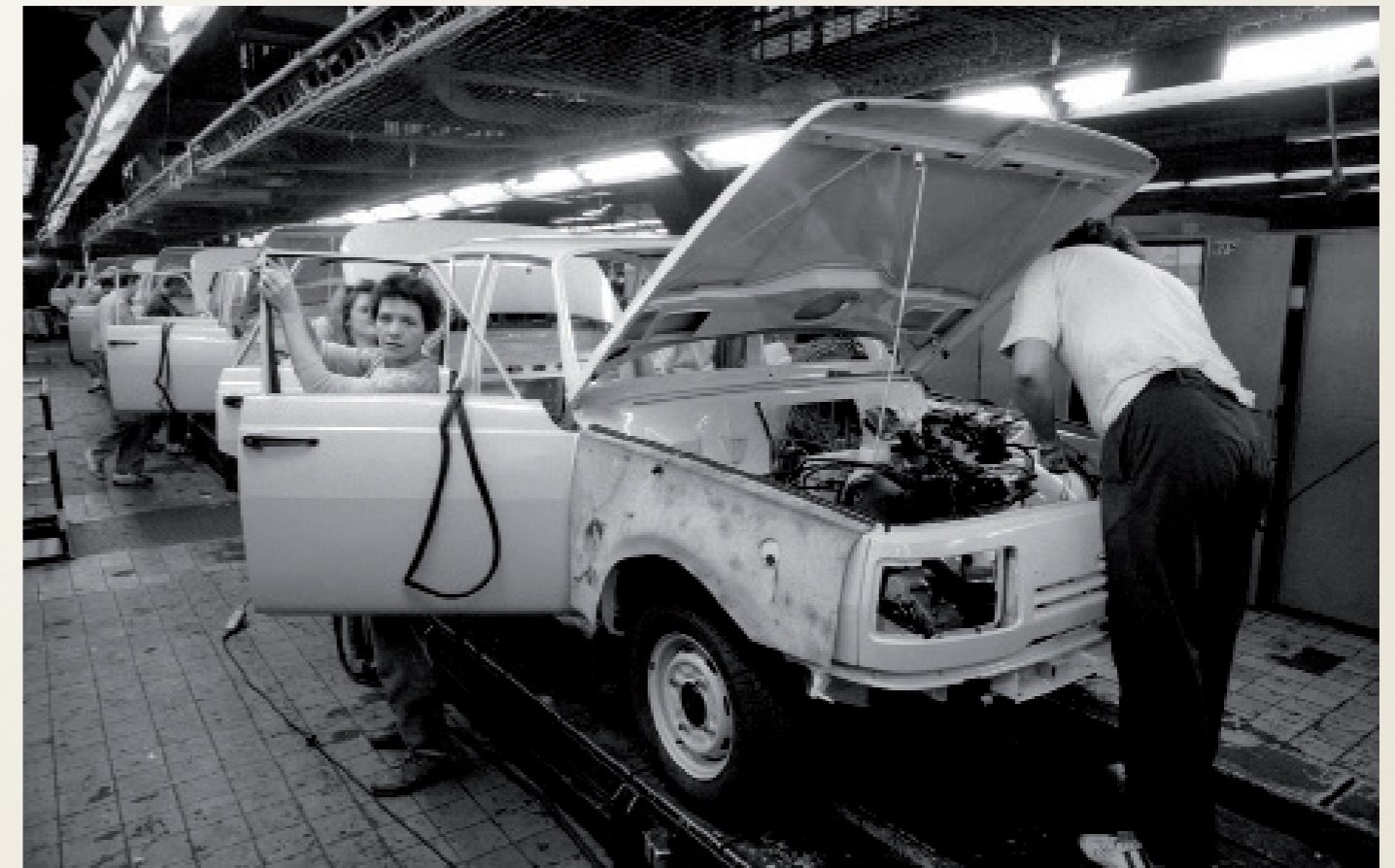
Nach der Wiedervereinigung/ Eisenach

Produktion des DDR-Automobils „Wartburg“ (Automobilwerk Eisenach (AWE)). Protestplakat gegen die „Treuhand“, im Büro eines Ingenieurs.