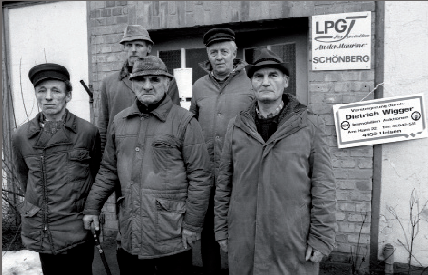
Nach der Wiedervereinigung/ Schönberg