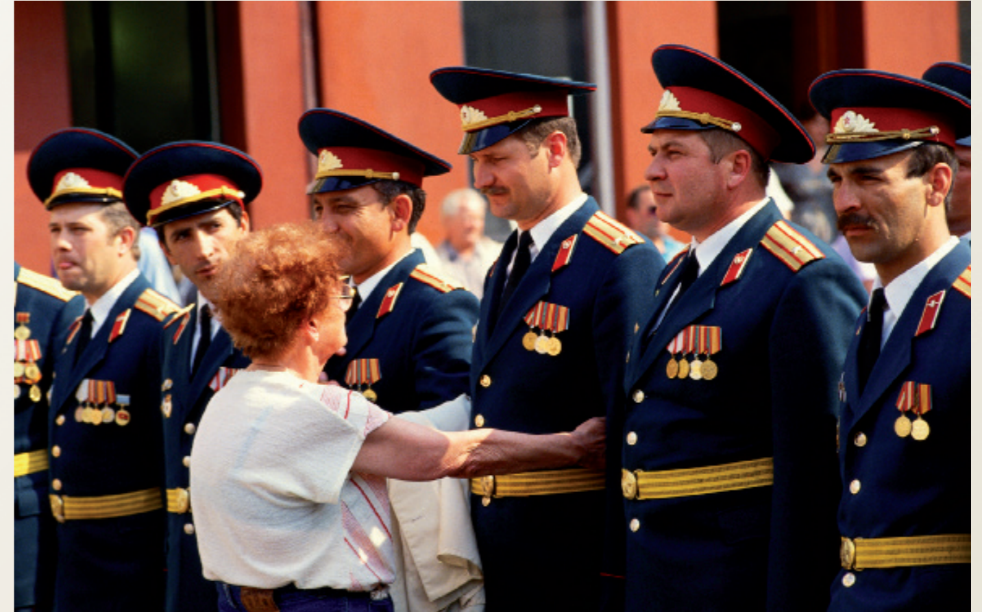
Nach der Wiedervereinigung/ Schwerin

Ruine der Frauenkirche, links Hotel Dresdner Hof.