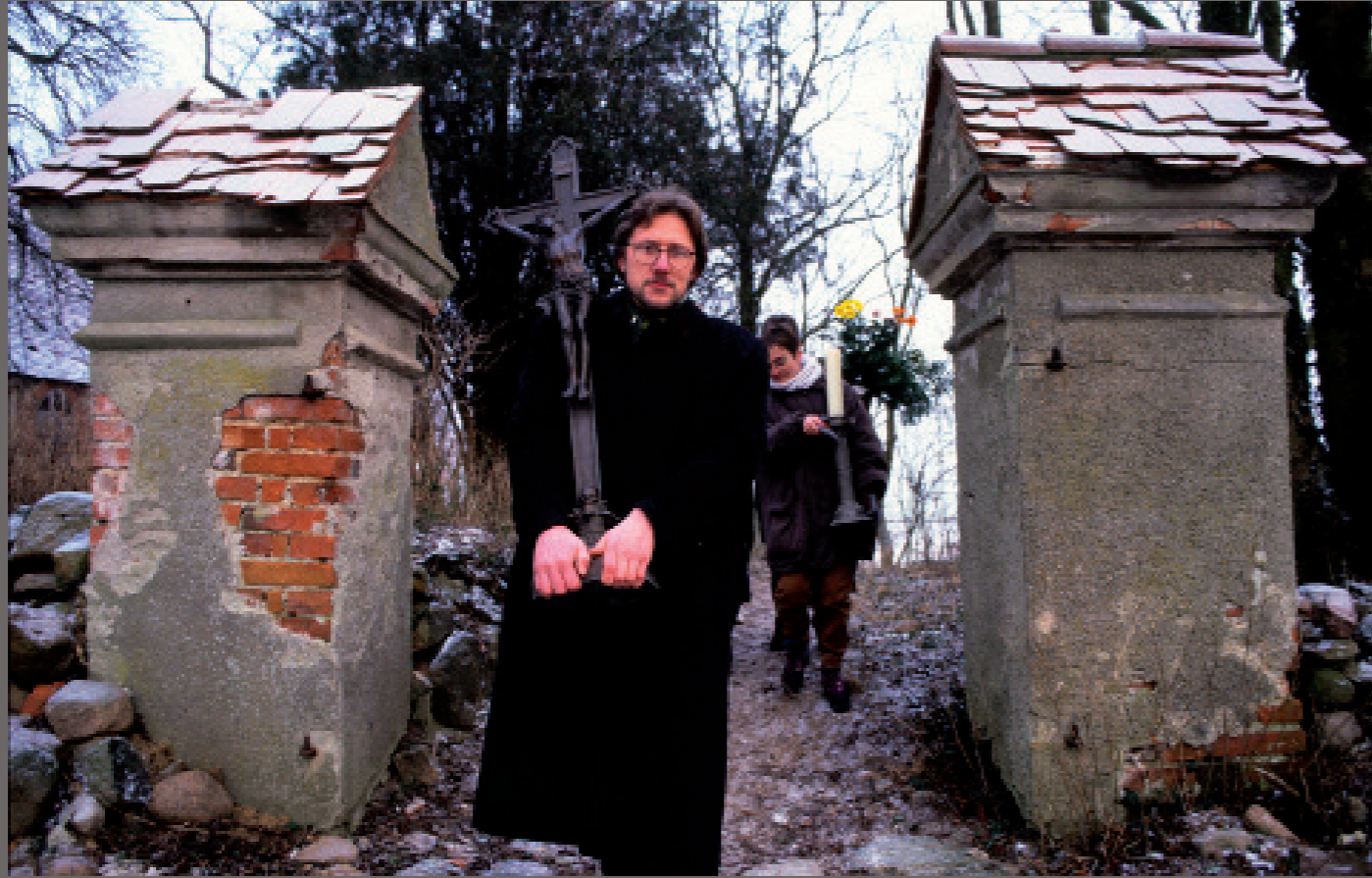
Nach der Wiedervereinigung/ Rollenhagen ( Mecklenburg-Vorp.)