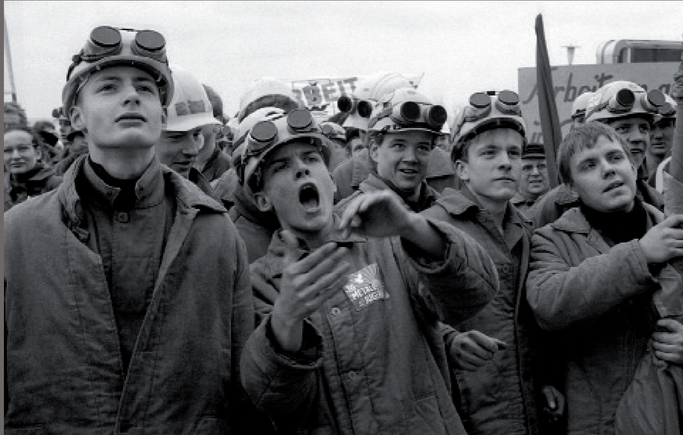
Nach der Wiedervereinigung/ Warnemünde