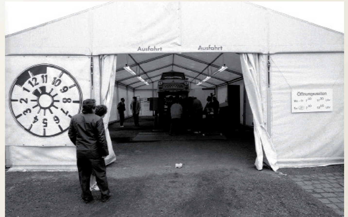
Nach der Wiedervereinigung/ Zwickau

Visafrei über die Grenze nach Polen bzw. umgekehrt nach Deutschland. Deutsche Nazis attackieren polnische Bürger nach dem Grenzübertritt.