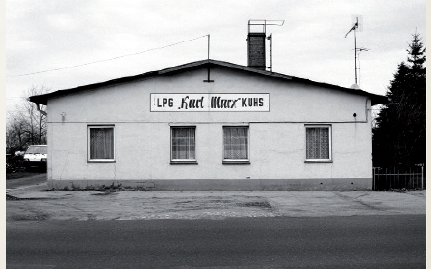
Nach der Wiedervereinigung/ Mecklenburg-Vorpommern

Asylbewerbern hauptsächlich aus Jugoslawien drängen sich in der Eingangshalle der Hamburger Ausländerbehörde. ( gesichert mit Hamburger Gittern, Stahldrehtür und Wachleuten ).