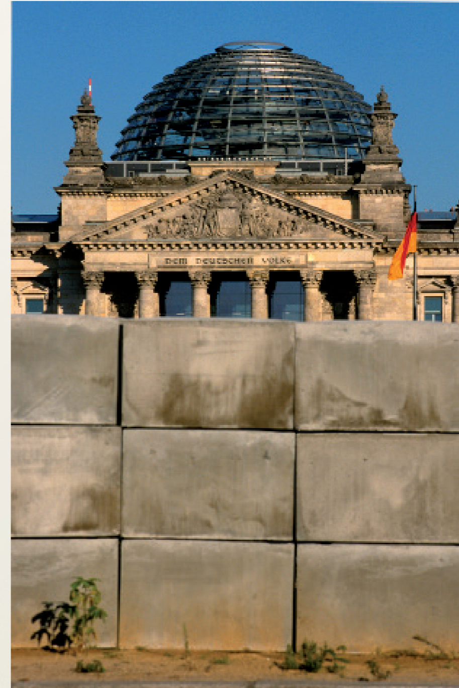
Nach der Wiedervereinigung/ Berlin

Evangelische Dorfkirche wird entwidmet und an einen Künstler verkauft.