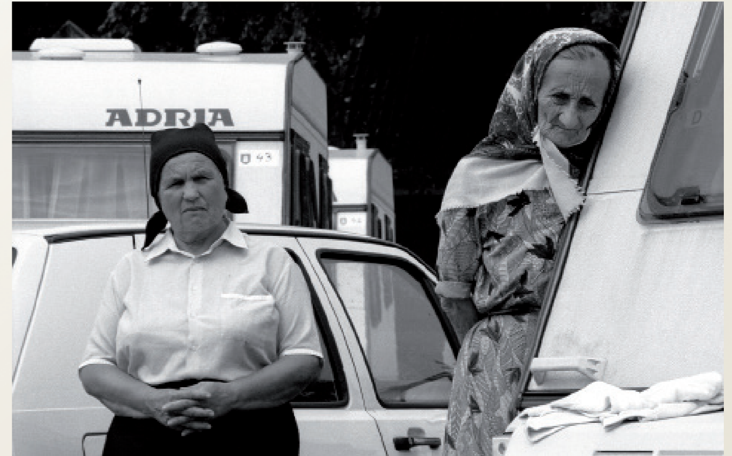
Zusammenbruch des Ostblocks/ Flüchtlinge/ Hamburg

Bundeskanzler Helmut Kohl besucht das BASF-Werk Schwarzheide. Es wurde 1990 von der Treuhandanstalt erworben. Mitarbeiter lauschen seiner Rede.