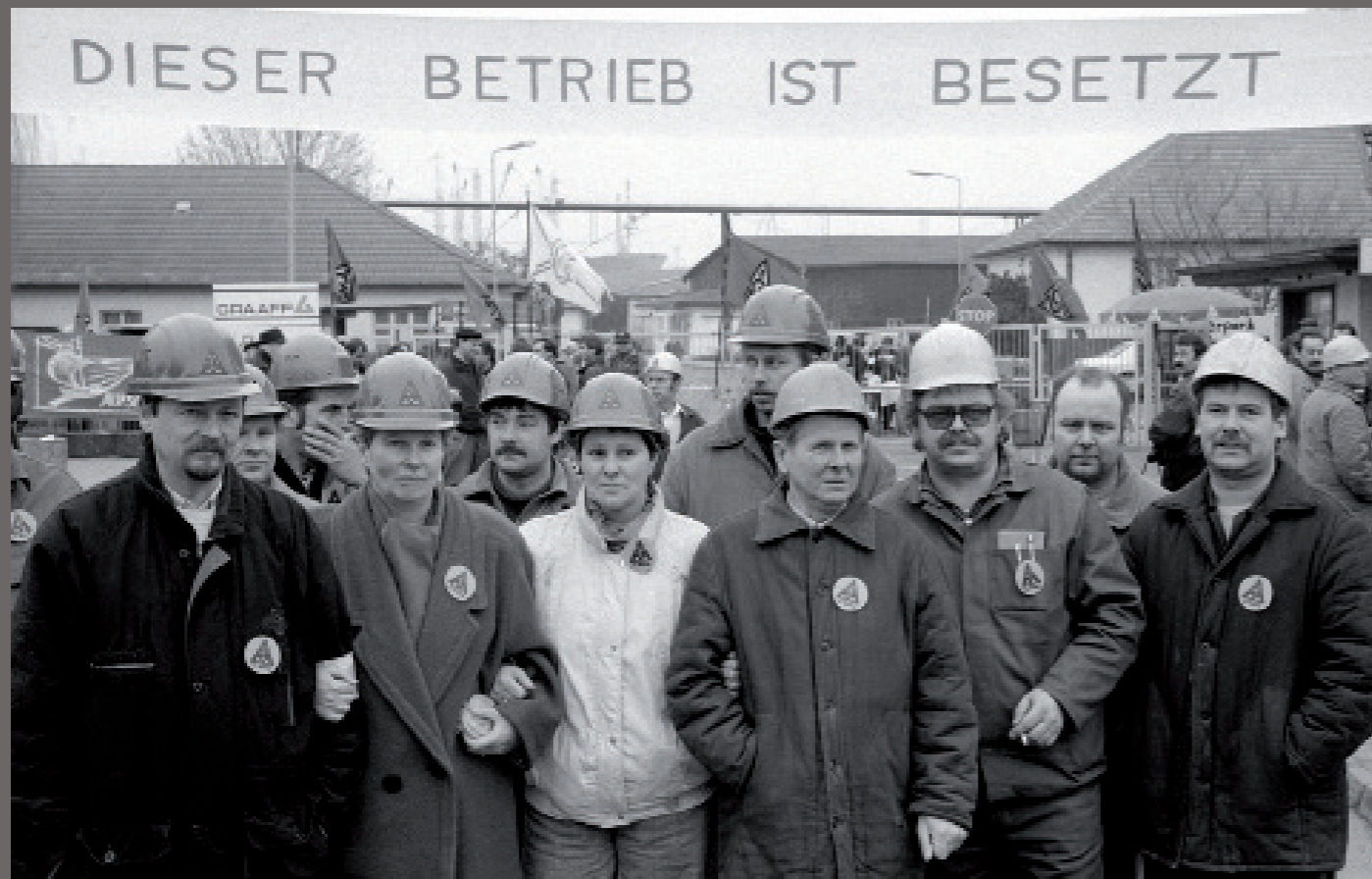
Nach der Wiedervereinigung/ Wismar