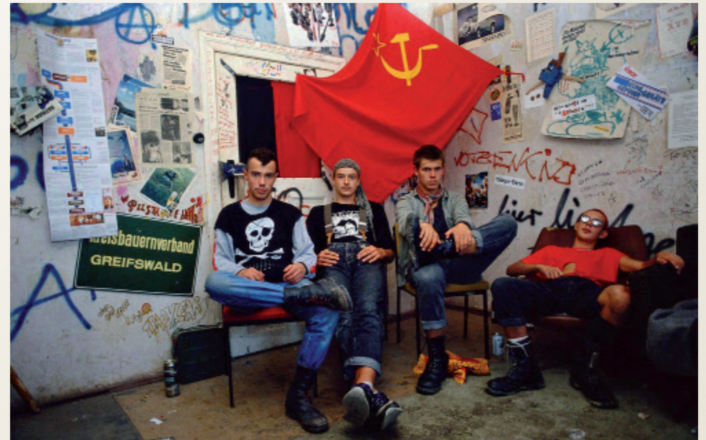
Nach der Wende in der ehemaligen DDR/ Greifswald

Potestkundgebung vor dem sowjetischen Konsulat gegen einen Putsch gegen den Staatspräsidenten der Sowjetunion Michail Gorbatschow.