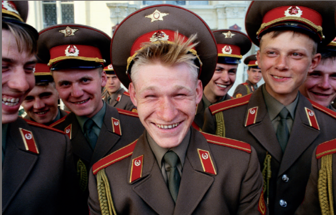
Nach der Wiedervereinigung/ Schwerin