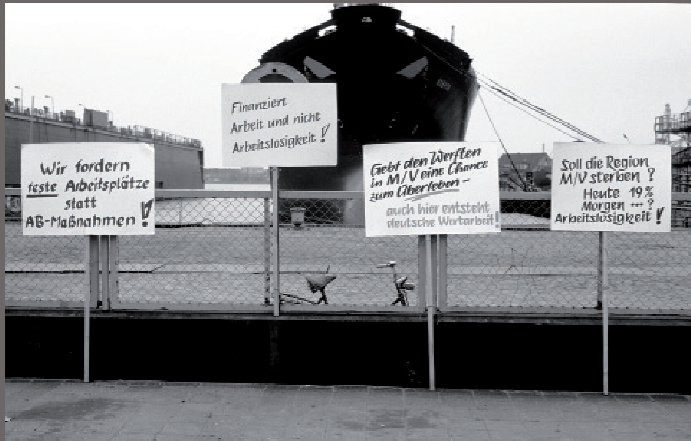
Nach der Wiedervereinigung/ Warnemünde