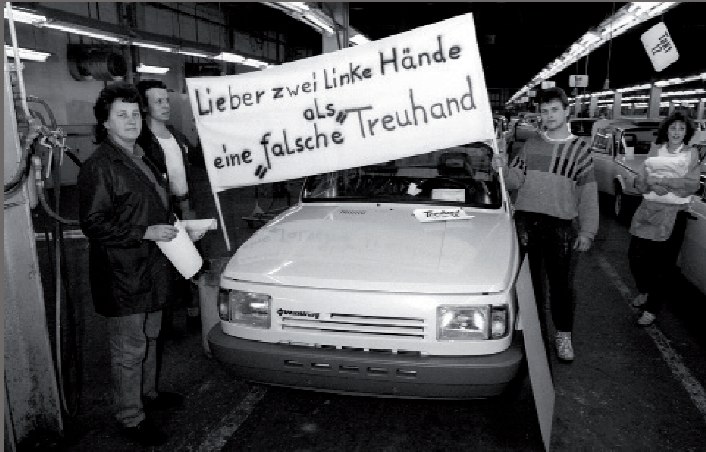
Nach der Wiedervereinigung/ Eisenach