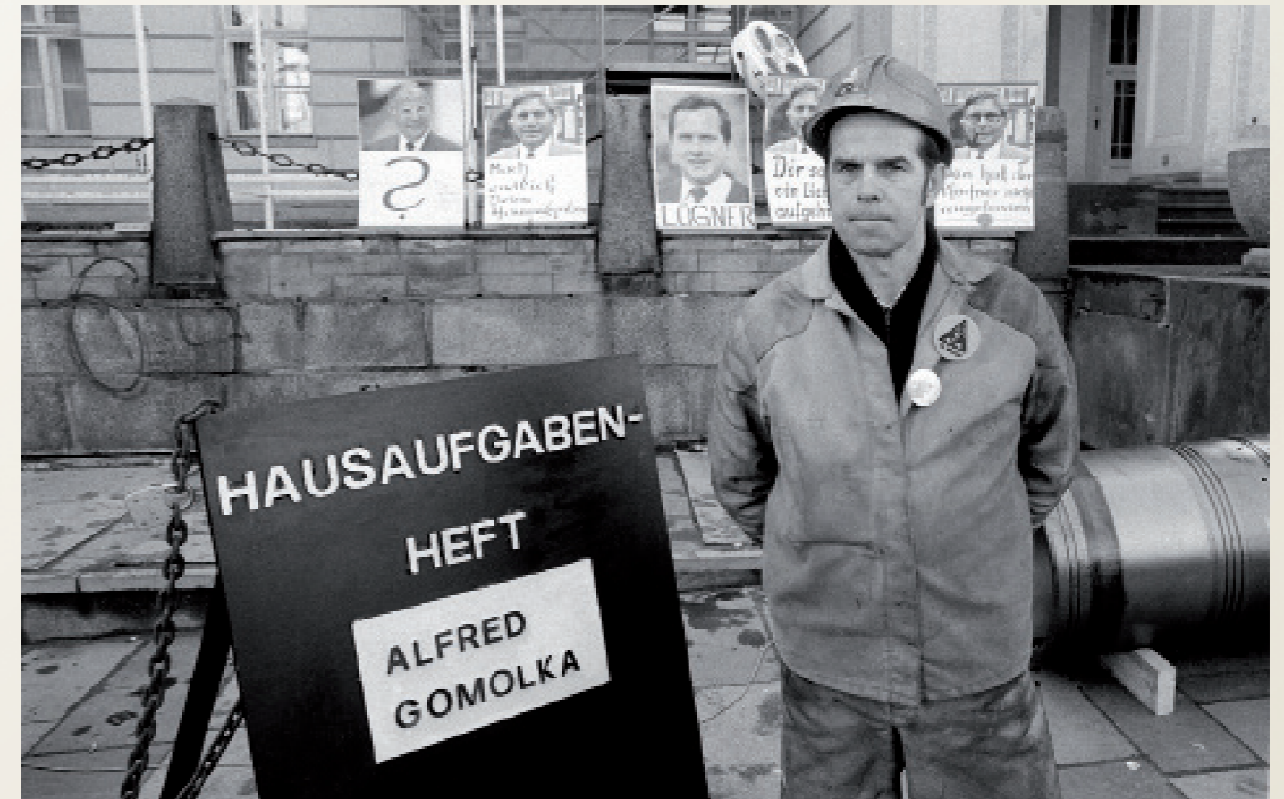
Nach der Wiedervereinigung/ Schwerin

Werftbesetzung der Neptun-War- now-Werft.