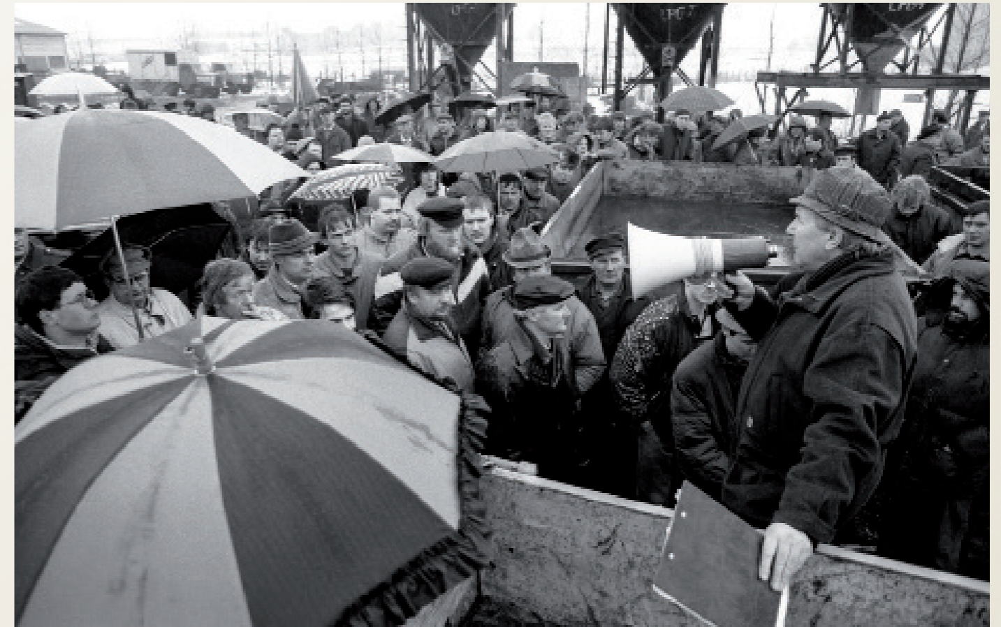
Nach der Wiedervereinigung/ Schönberg

Versteigerung des Inventars der LPG Tierproduktion „An der Maurine“ in Schönberg (Mecklenb.-Vorp.) durch einen westdeutschen Auktionator. Empörte Bauern.