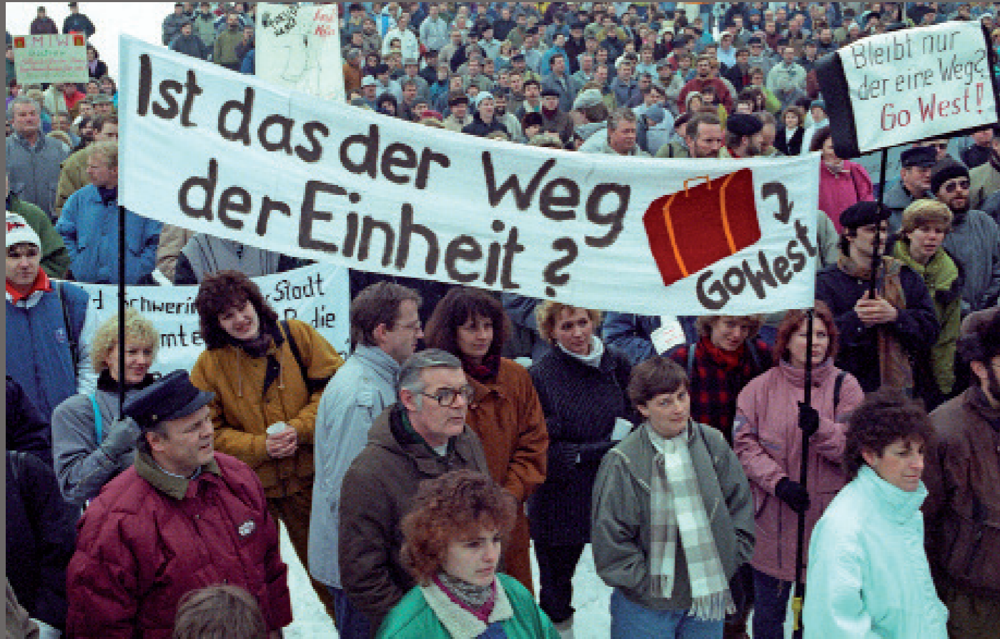
Nach der Wiedervereinigung/ Schwerin