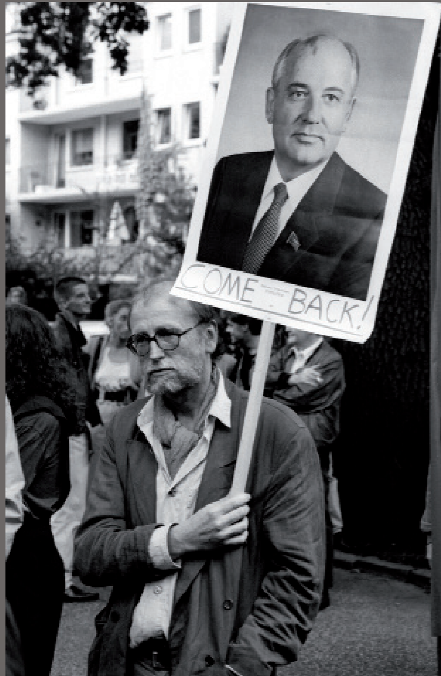
Nach der Wiedervereinigung/ Hamburg