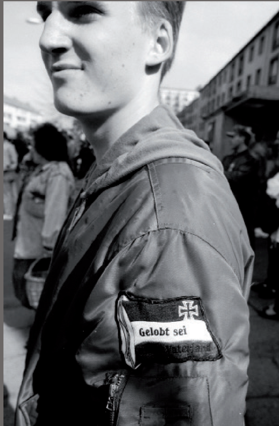
Nach der Wiedervereinigung/ Frankfurt a.d. Oder