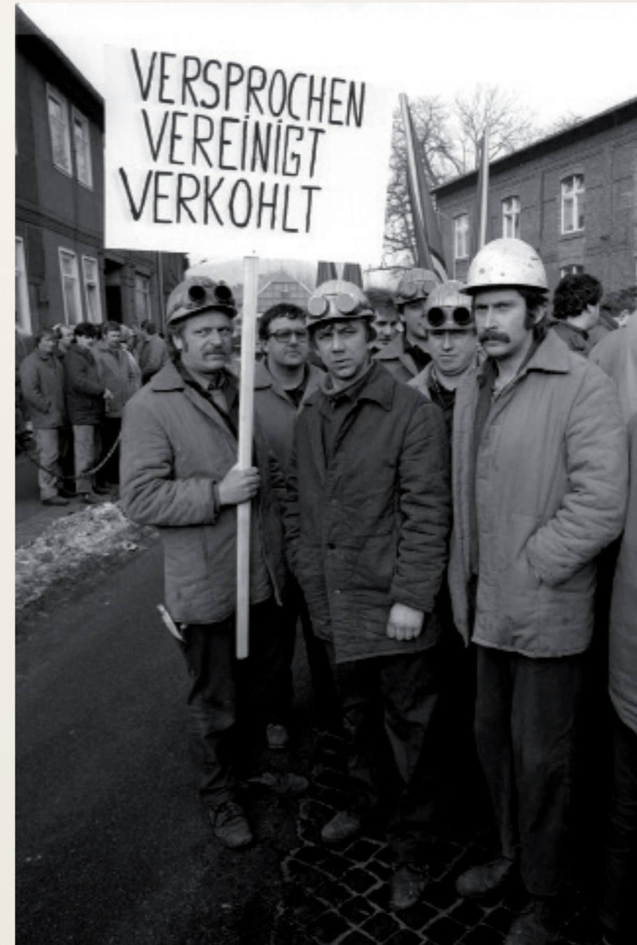
Nach der Wiedervereinigung/ Eisenach

Produktion des DDR-Autos „Wartburg“ ( AWE Eisenach ). Protest gegen die endgültige Schließung des Werkes durch die Treuhandanstalt. Am 14.04.1991 wurde die Produktion stillgelegt.