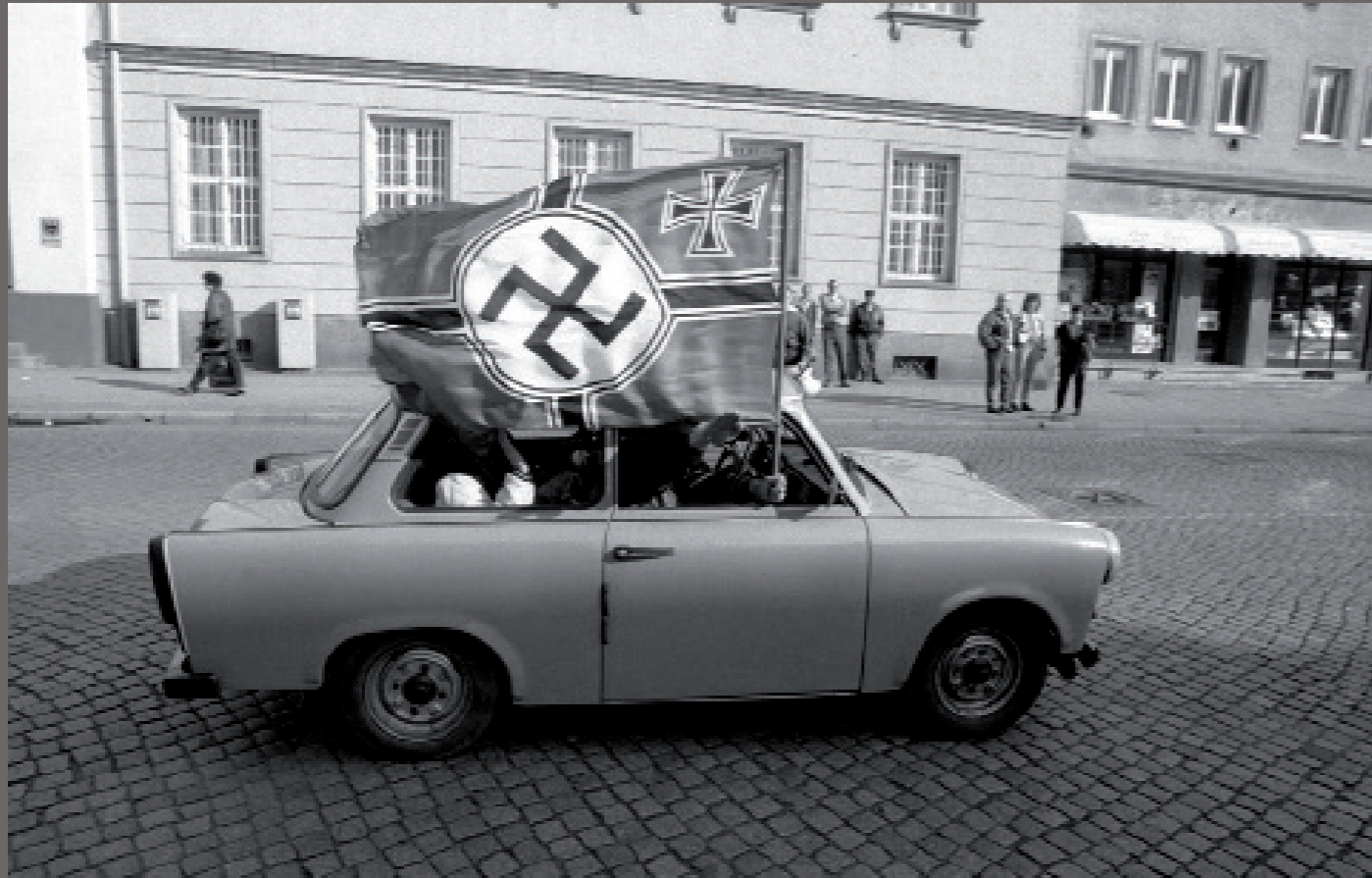
Nach der Wiedervereinigung/ Neubrandenburg