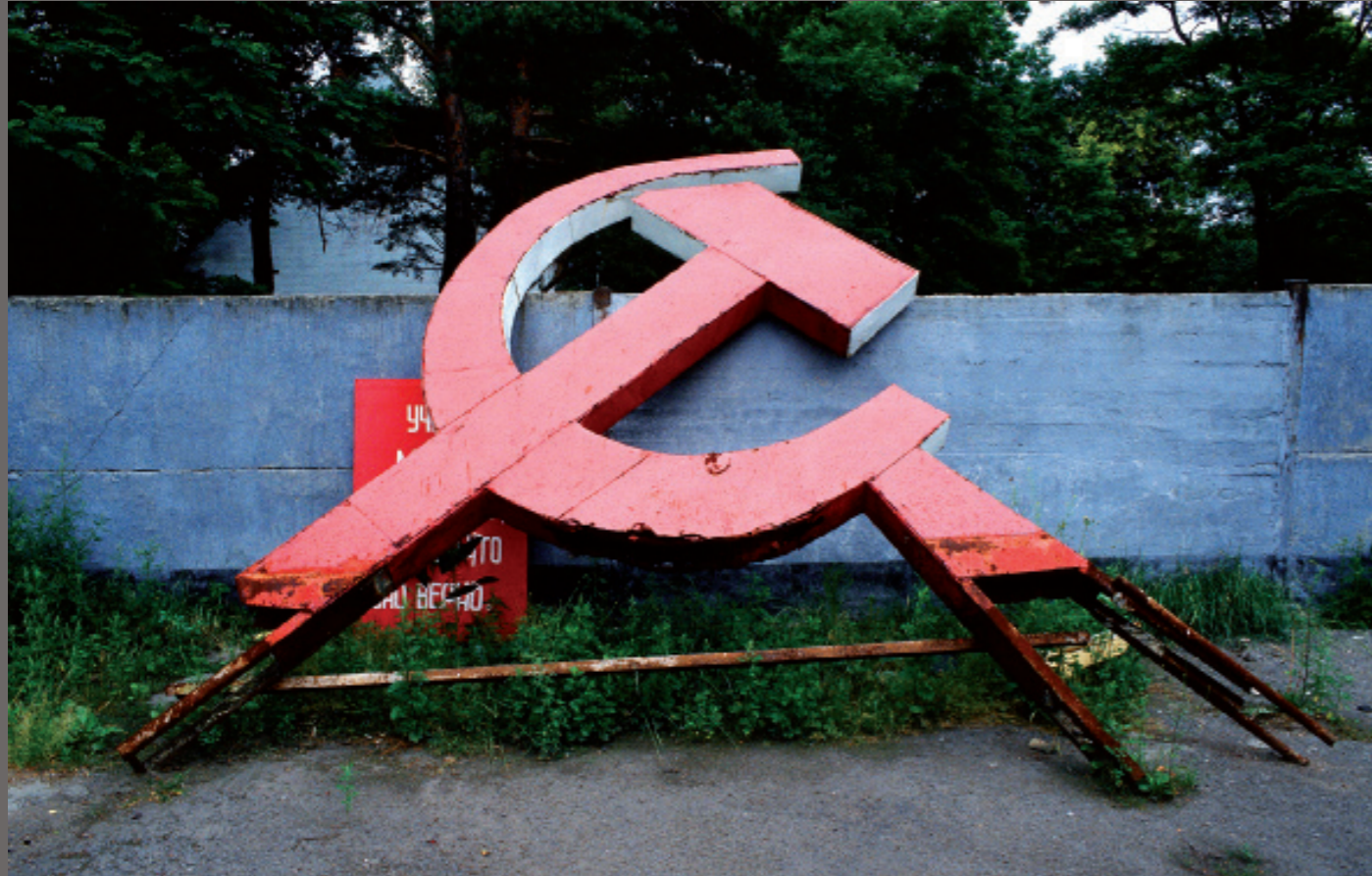
DDR nach der Wende/ Fürstenberg