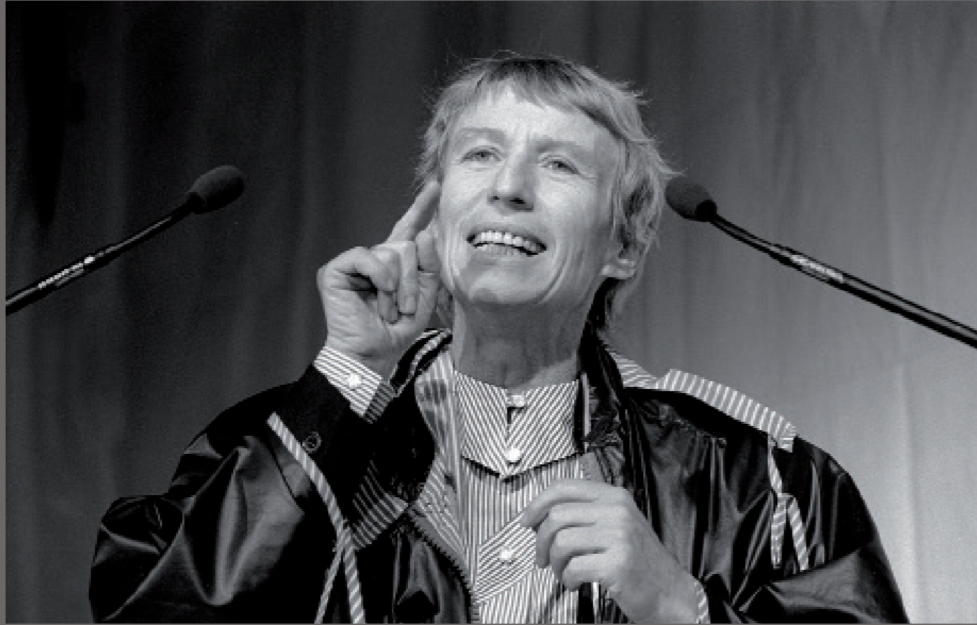
Nach der Wiedervereinigung/ Hamburg