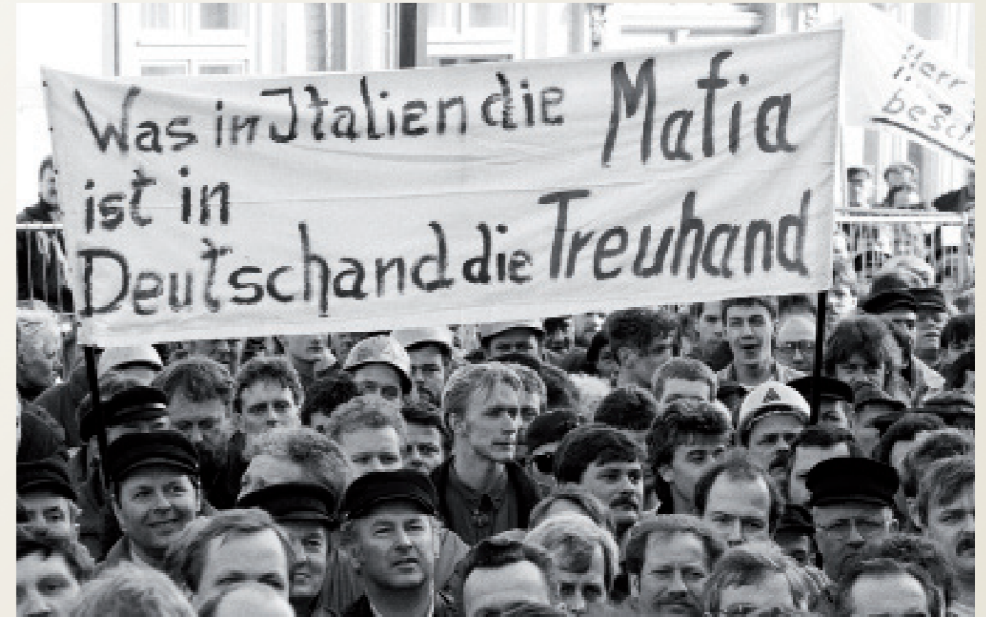
Nach der Wiedervereinigung/ Schwerin

Demonstration der Werft- und Metallarbeiter in Schwerin gegen die Landesregierung Gomolka und den CDU-Landesvorsitzenden Günther Krause.