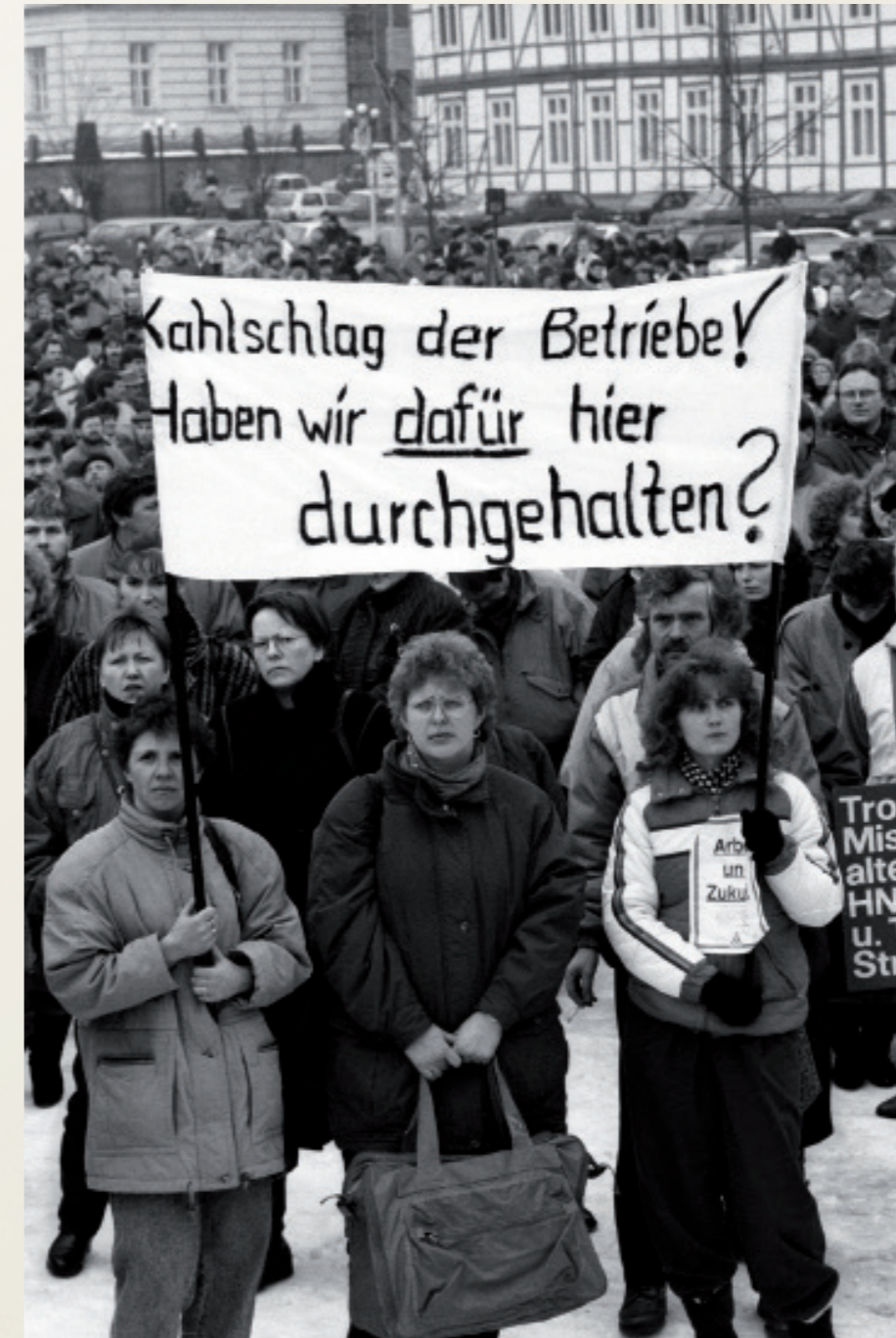
Nach der Wiedervereinigung/ Schwerin

Demonstration gegen die Arbeitsplatzvernichtungsstrategie der Treuhandanstalt.