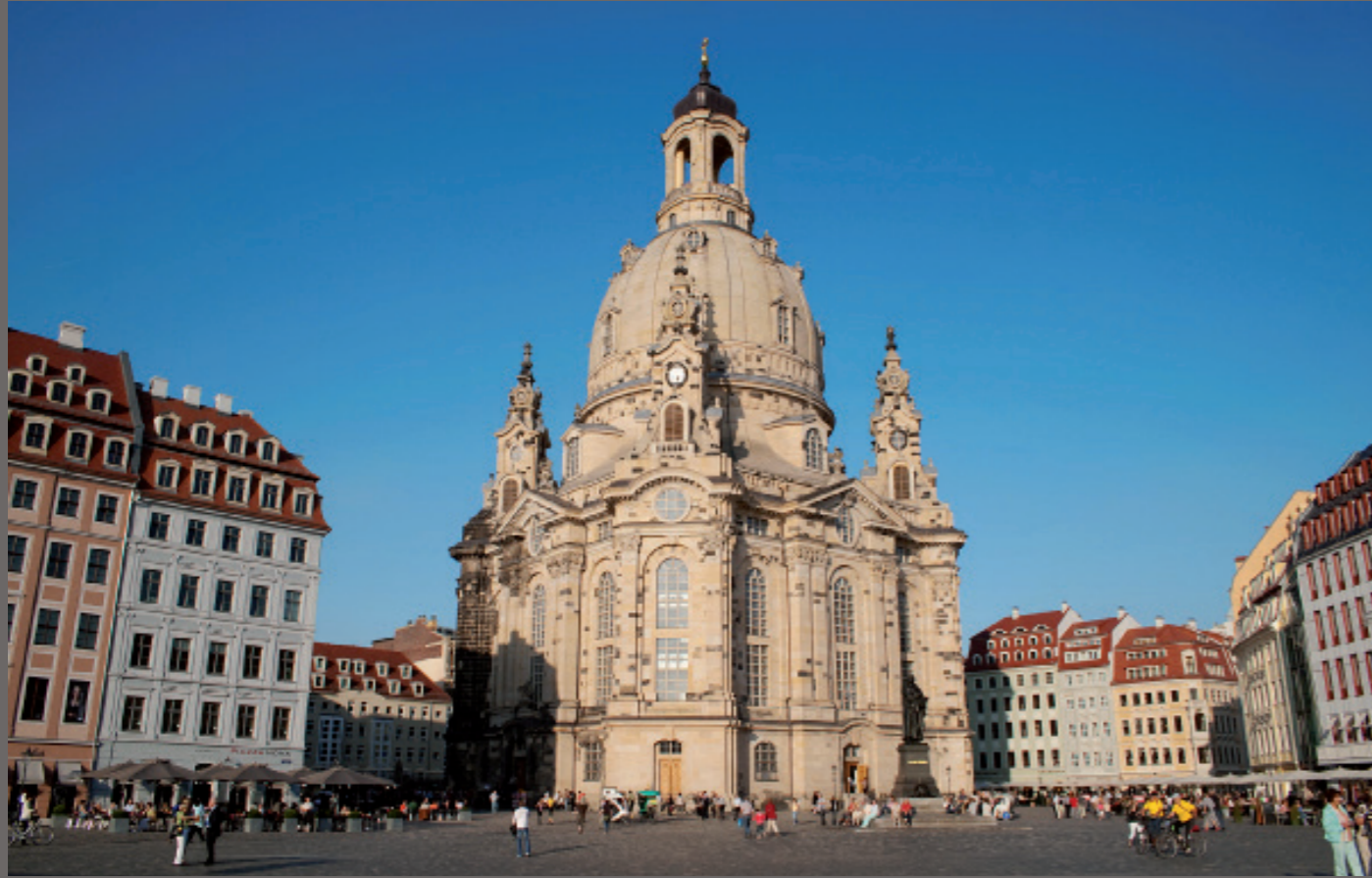
Nach der Wiedervereinigung/ Dresden