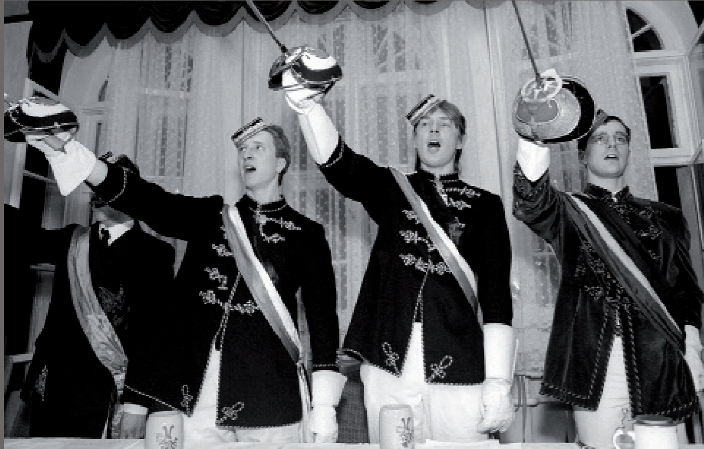
Nach der Wiedervereinigung/ Greifswald