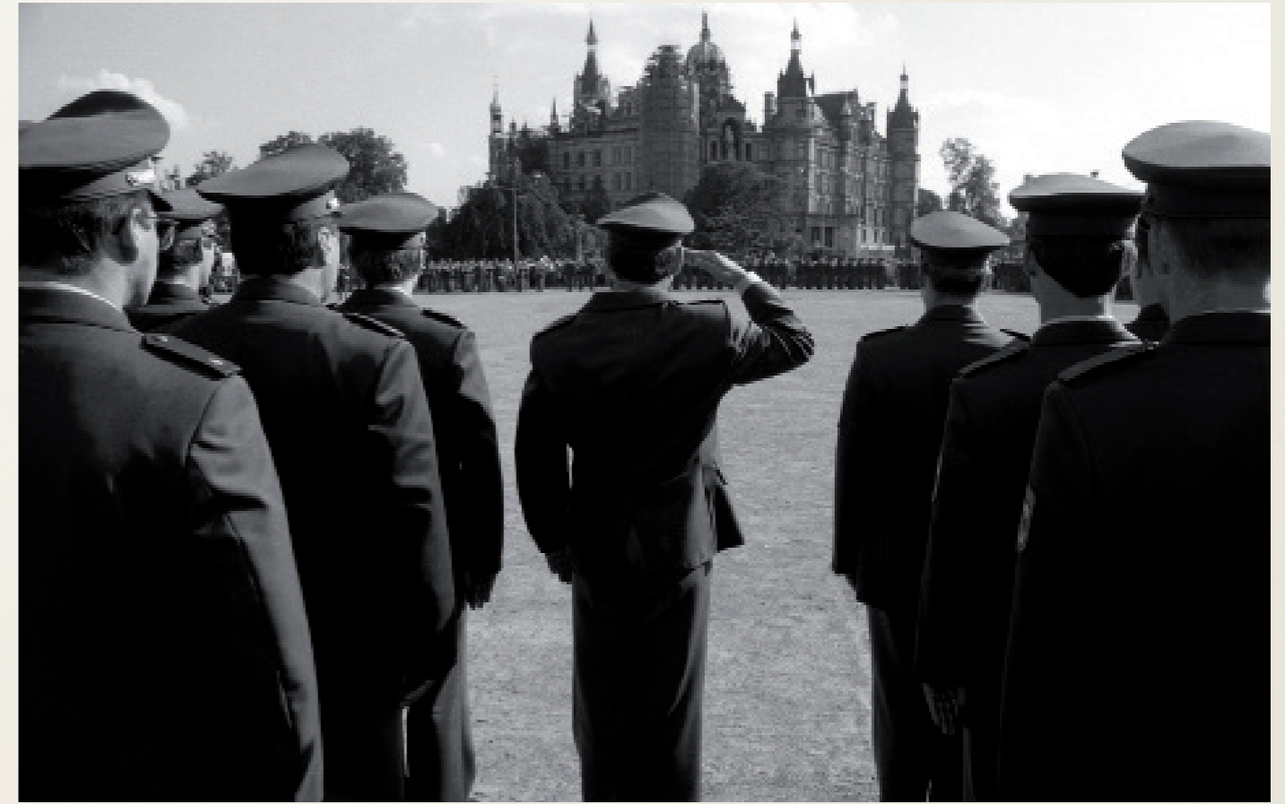
Nach der Wiedervereinigung/ Schwerin

Trabis aus dem Öffentlichen Dienst der DDR werden auf einem Flugplatz zusammengezogen und von der „VEBEG“ zum Verkauf angeboten.