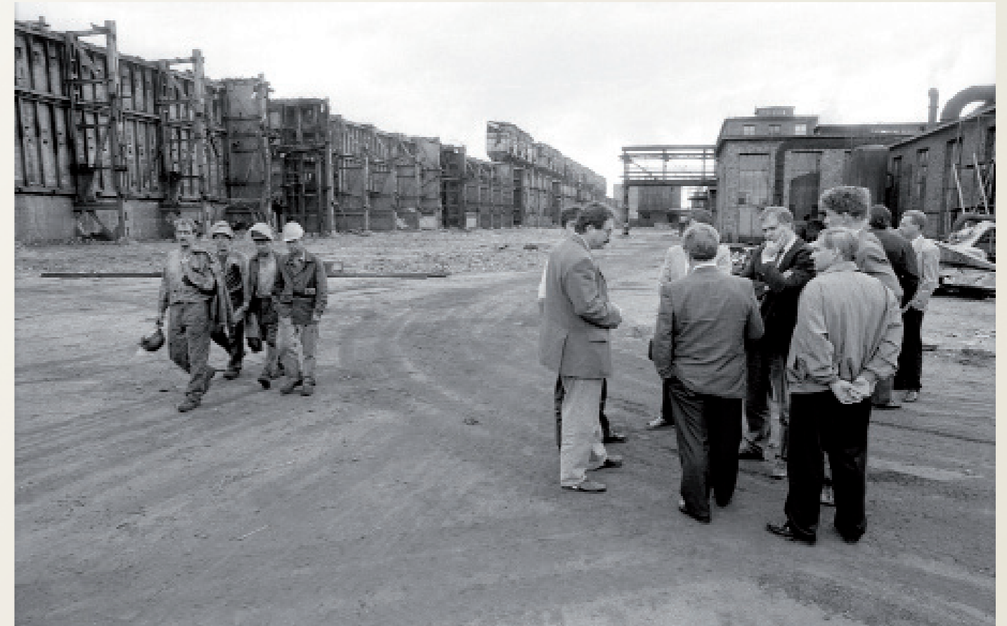
Nach der Wiedervereinigung/ Lauchhammer