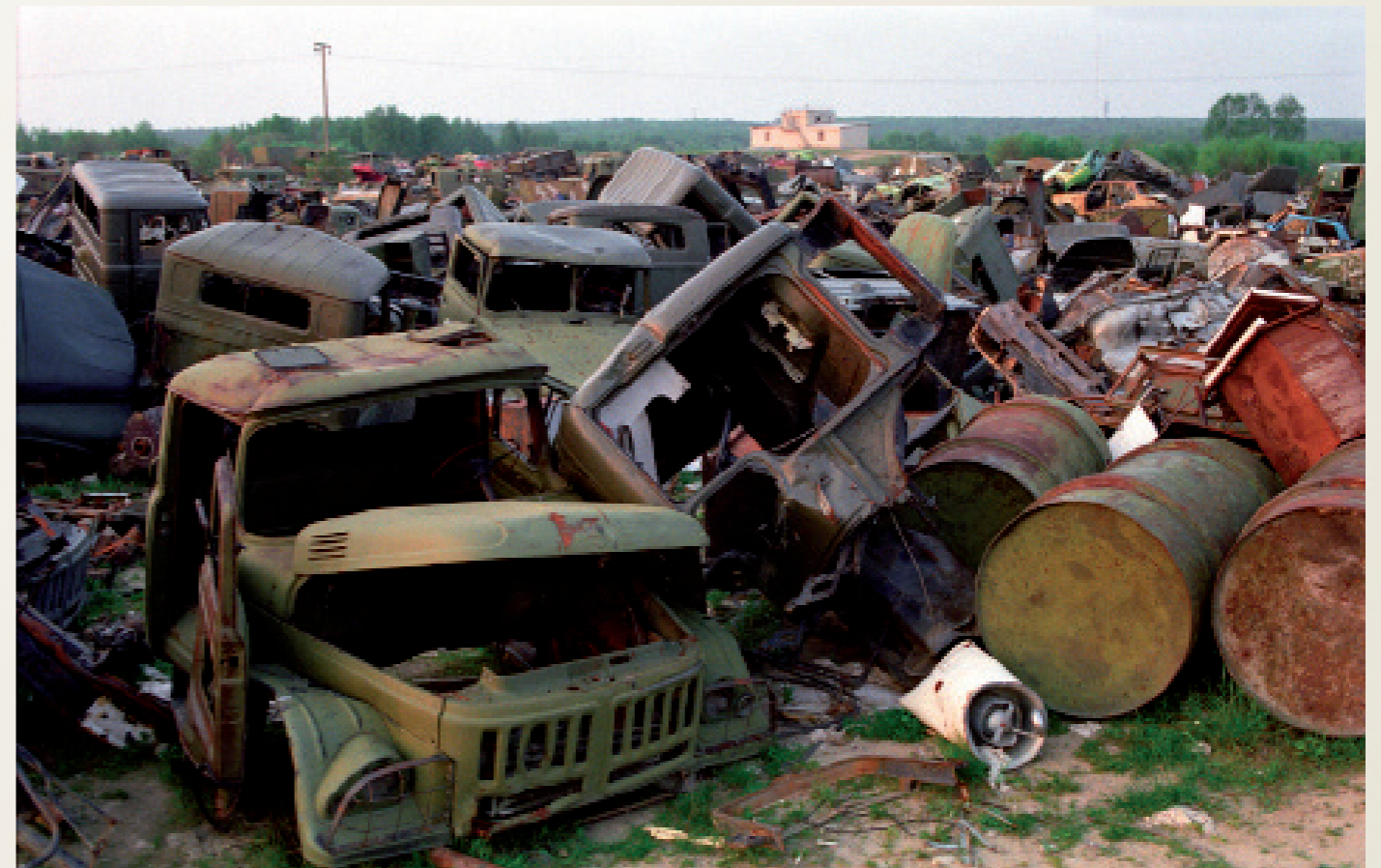
Nach der Wiedervereinigung/ Schwerin

Fahrradtour der CDU-Landtagsfraktion von Mecklenburg-Vorpommern. Angela Merkel (CDU-Landesvorsitzende) vorn im Bild, dahinter Eckard Rehberg, CDU-Fraktionsvorsitzender.