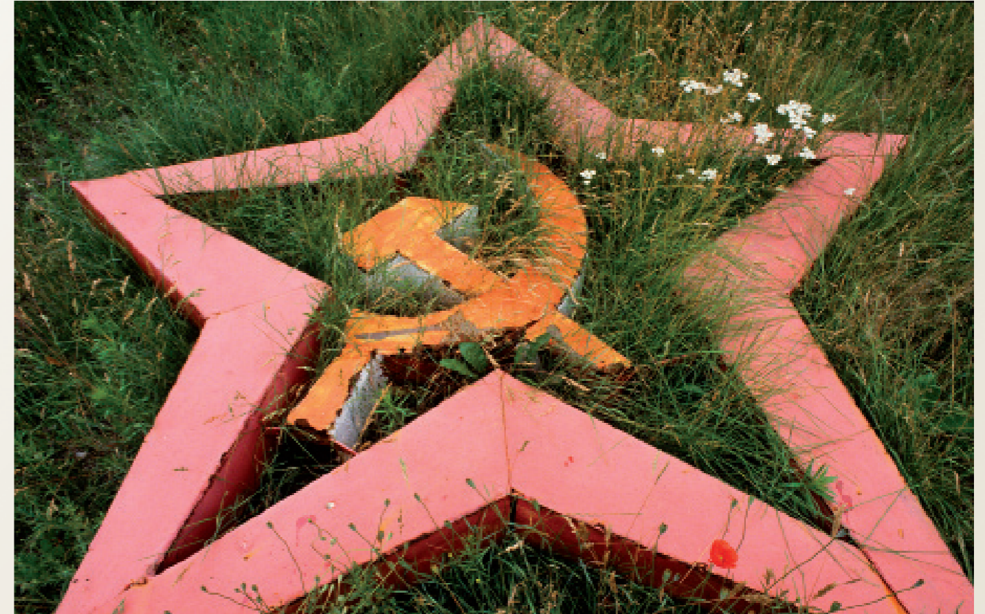
DDR nach der Wende/ Fürstenberg

Wandmalerei an einer Kaserne der „Roten Armee“ der Sowjetunion . Soldat der sowjetischen Armee ( links ), Soldat der Nationalen Volksarmee ( NVA) der DDR