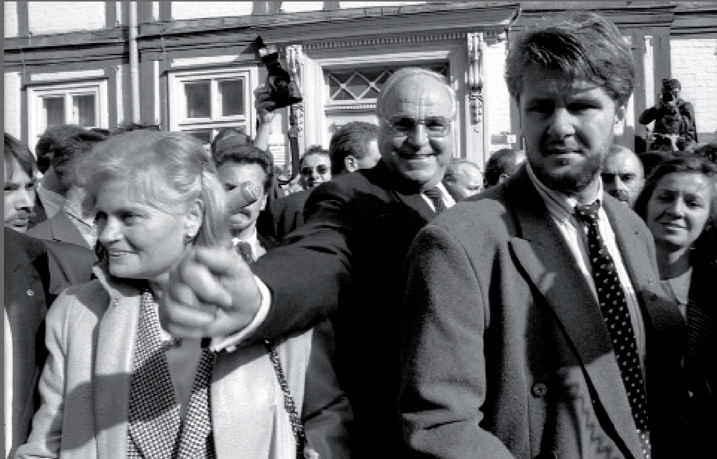
Nach der Wiedervereinigung/ Schwerin