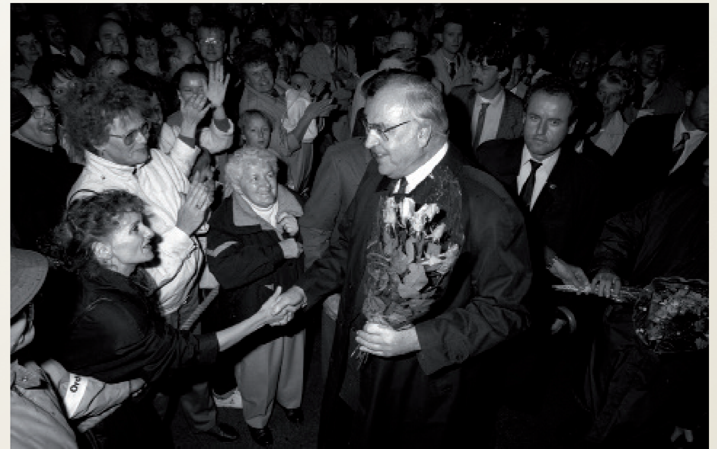
Nach der Wiedervereinigung / Neubrandenburg

Tag der Deutschen Einheit . Aus der DDR ausgebürgerter Liedermacher Wolf Biermann auf der ARD-Bühne.