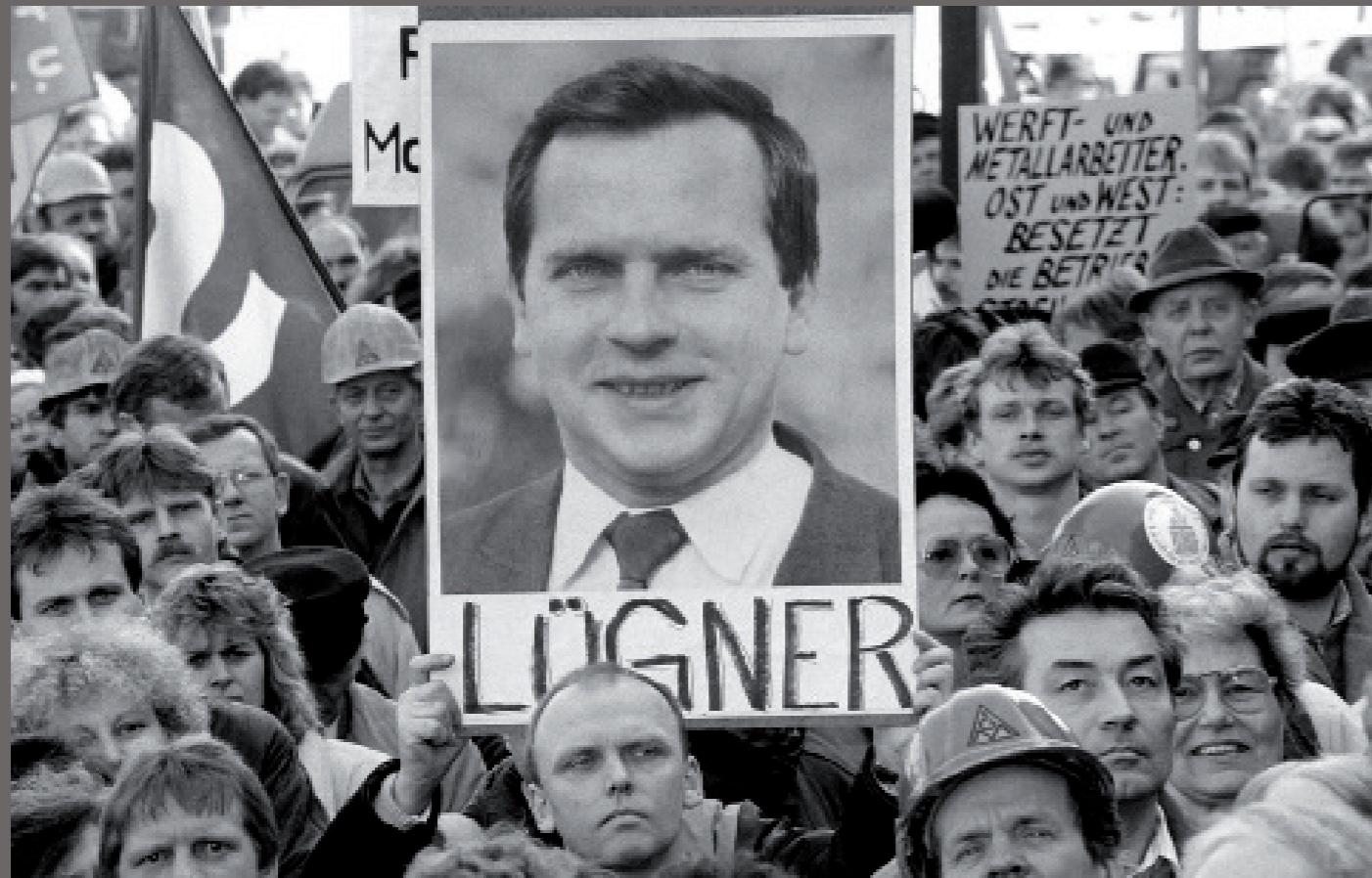
Nach der Wiedervereinigung/ Schwerin