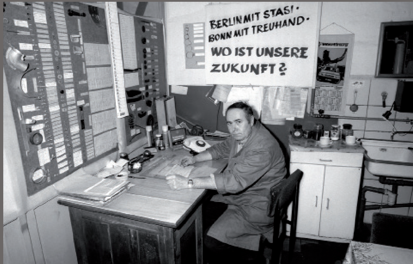
Nach der Wiedervereinigung/ Eisenach