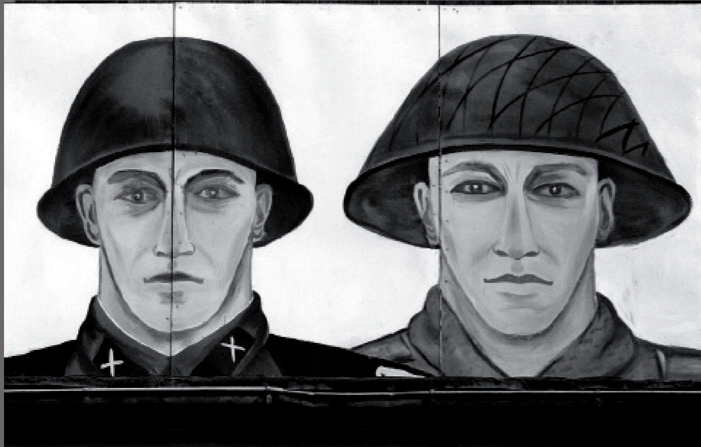
Nach der Wende in der DDR/ Borna