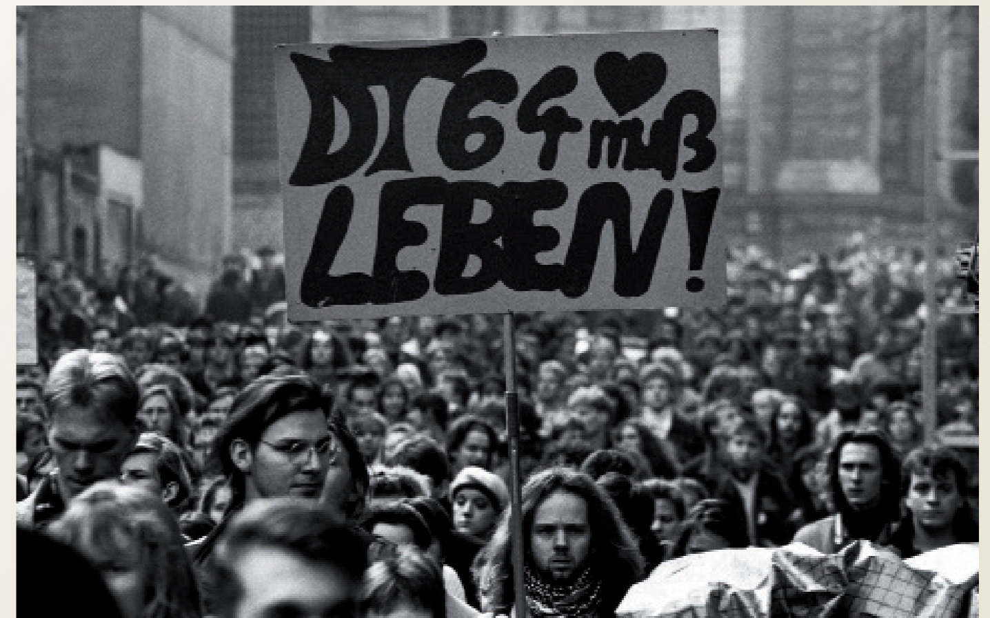
Nach der Wiedervereinigung/ Schwerin

Werftbesetzung der Mathias-Thesen-Werft (MTW).