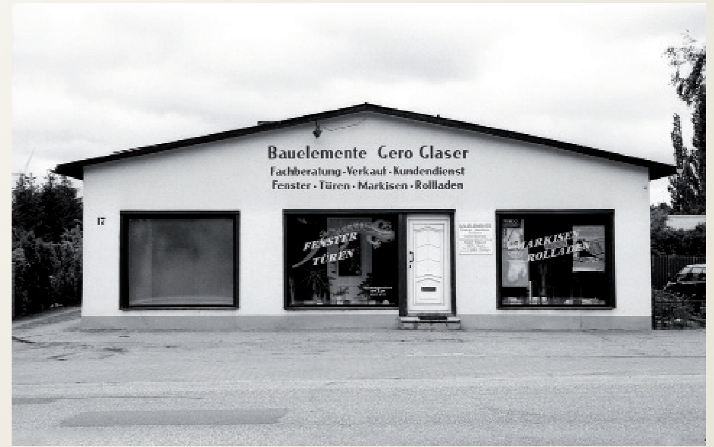
Nach der Wiedervereinigung/ Mecklenburg-Vorpommern

Ehemaliges Verwaltungs-Gebäude der LPG Tierproduktion „An der Maurine“ jetzt Jugendclub mit westdeutscher Sozialpädagogin.